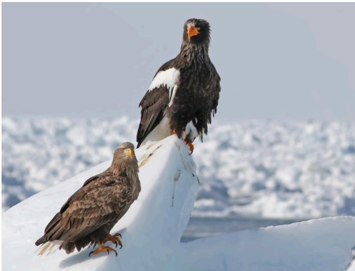
Havsörn och Steller's Eagle

16 februari. Efter att ha observerat fåglarna vid matningen beger vi oss mot Kushiro. På vägen kan vi besöka området runt Kussharosjön, som är känd för övervintrande Whooper Swans i de varma källorna, men som också har Grey-headed och Black Woodpecker. Vi kan också besöka ställe för Ural Owl. Vid Tsurui möter vi flockarna av Red-crowned Cranes som övervintrar här, och vi håller utkik efter ovanliga tättingar, samt Crested Kingfisher och Japanese Wagtail. Natt på Century Castle Hotel i Kushiro