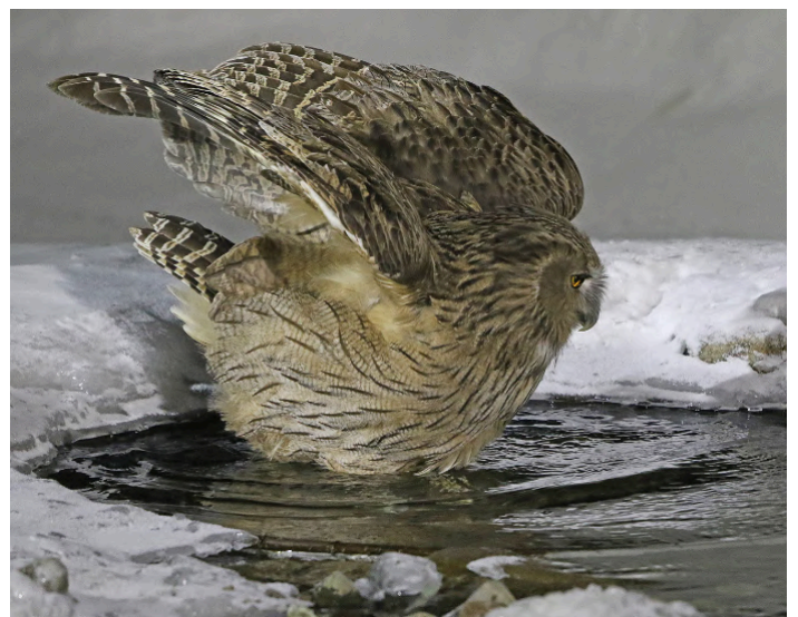
Blakiston's Fish Owl

14 februari. Efter frukost åker vi till Nemuro, där vi kommer att utforska Nosappu Cape och sjön Furen. Red-faced Cormorant finns vanligtvis bland de många pelagiska fåglarna, och havsskådning kan ge Ancient Murrelet och Least Auklet. Närliggande klippor kan hysa Rock Sandpiper (sällsynt), och Asian Rosy Finch är regelbunden men ibland svår att hitta. Om det finns intresse och vädret tillåter kan vi ta en pelagisk tur för att komma närmare några av alkfågeln (extra kostnad). På sen eftermiddag åker vi till vårt traditionella japanska onsen-hotell (1,5 timme). På kvällen finns det en mycket god chans att se Blakiston's Fish Owl vid floden utanför vårt boende (det kan bli en lång väntan). Det finns ofta Solitary Snipe någonstans längs floden, och matningarna där lockar ett antal tättingar. Natt på Dai Ichi Yuryado, nära