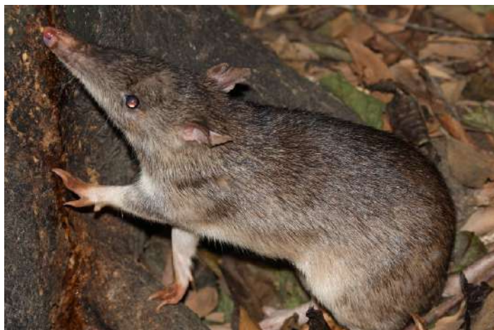
Long-nosed Bandicoot.

6 oktober. Idag ska vi skåda fågel i Cairns. Vi kommer besöka Cairns Esplanade, Botanical garden, Centenary Lakes och Cattana Wetlands. Naturmiljöer som vi vistas idag är låglandsregnskog, sötvattensvåtmarker, mangroveskog och tidvatten-stränder. Listan på fåglar blir lång – vadare, hägrar, papegojor, änder och storfotshöns. Natt i Cairns.