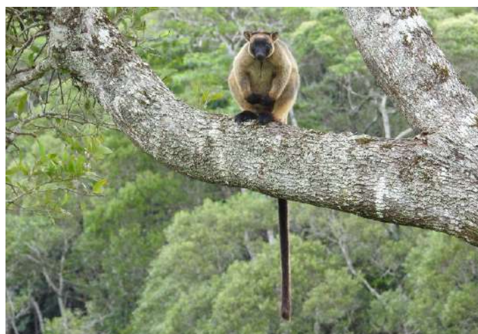
Lumholtz's Tree Kangaroo.

11 oktober. Vi lämnar Yungaburra och reser via Mareeba till Mossman. Som vanligt spanar vi efter djur och fåglar längs vägen. Fåglar som vi kan se i dessa torrare livsmiljöer inkluderar Cotton Pygmy-goose, Australian Bustard, Black-necked Stork, Red-tailed Black-Cockatoo, Red-winged Parrot, Squatter Pigeon, Grey-crowned Babbler, Great Bowerbird, Pale-headed Rosella, Blue-winged Kookaburra och Yellow Oriole. Vi kommer till slut ned till det fuktigare kustområdet och övernattar i Mossman.