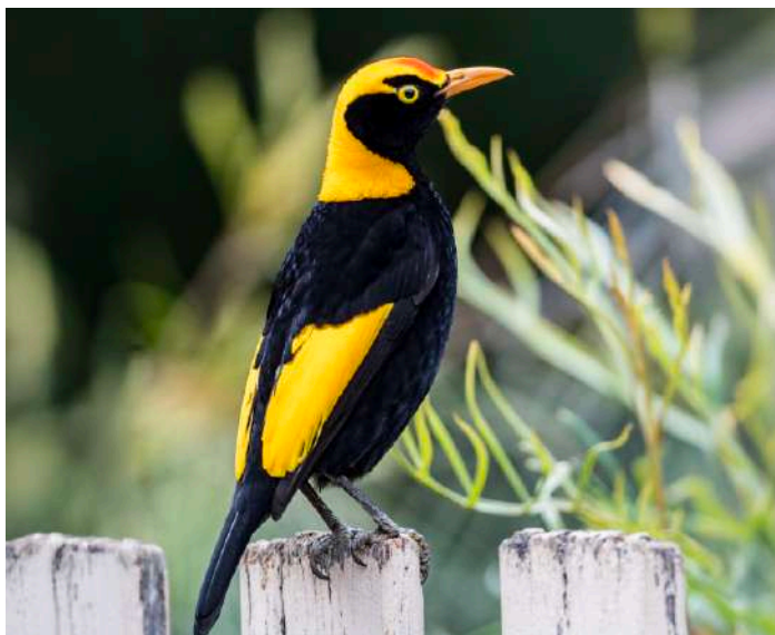
Regent Bowerbird.