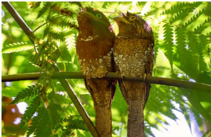
Sri Lanka Frogmouth

20 februari. Hela dagen ägnar vi åt att utforska de dimhöljda bergen kring Riverston och har med oss picknicklunch. Natt i Kandy.