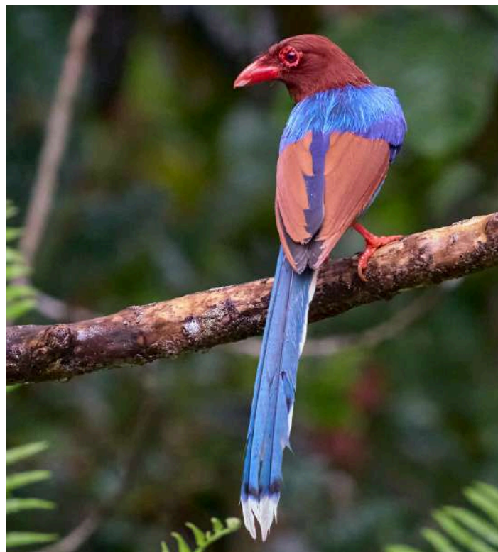
Sri Lanka Blue Magpie

23 februari. Efter frukost kör vi de två timmarna till Belihuloya, där vi tillbringar eftermiddagen. Natt i Belihuloya.