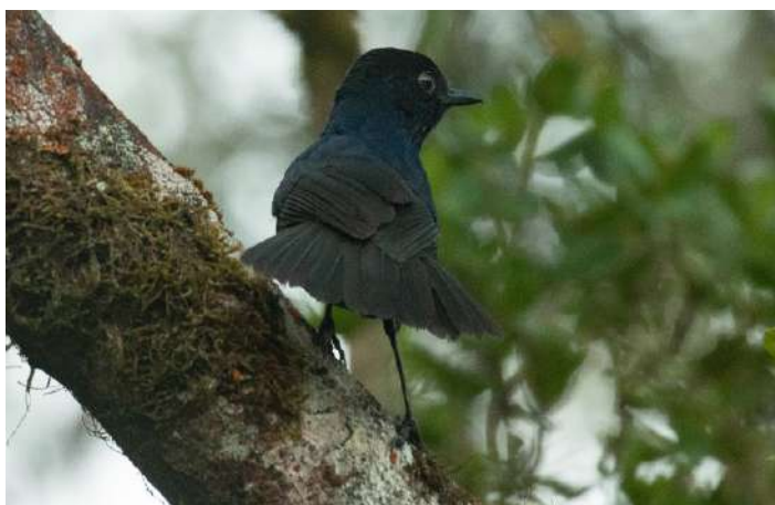
Sri Lanka Whistling Thrush

22 februari. Heldag vid Horton Plains där vi bland annat försöker se den svåra Sri Lanka Whistling Thrush. Den sitter sällan öppet, så det kan bli lite knepigt med autofokusen på grund av alla grenar. Vi kommer också besöka en théfabrik. Natt i Nuwara Eliya.