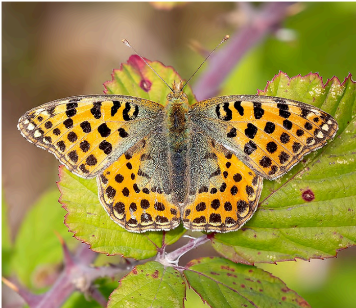
Queen of Spain Fritillary

2 juni. Vi utforskar nationalparken Sierra de Gredos och njuter av lokala fåglar som den iberiska formen av svartvit flugsnappare, bergsångare och med chans på lammgam. Natt på hotellet Hostal al Manzor.