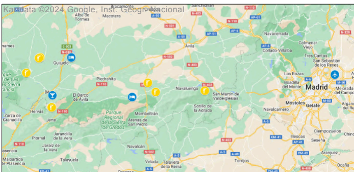
Fågellokaler under resan. Se dag-för-dagprogrammet.

Vi rör oss i vackra och glest befolkade marker, med berg, floddalar och ekskogar. Det finns också en intressant flora som vi ägnar uppmärksamhet åt.