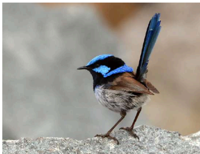
Superb Fairywren.

Idag var det dags att lämna Tasman Peninsula men innan vi gjorde det tog vi en liten promenad nära hotellet. Vi såg en Southern Brown Bandicoot och Tasmanian Scrubwren. Vi såg även färsk spillning från pungdjävul. Sedan var det dags att ta sikte på Bruny Island där vi skulle bo de två kommande nätterna. På vägen dit stannade vi i en liten park utanför Hobart. Där fick vi se den söta men tyvärr utrotningshotade papegojan Swift Parrot. Det är pungdjuret Sugar Glider, som kom hit med britererna för två hundra sedan, som är det största hotet eftersom de äter upp både ägg och ungar till papegojan.