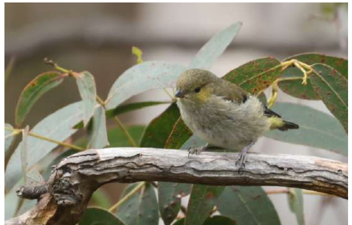
Forty-spotted Pardalote.

Efter vila och middag for vi ut på en kvällstur för att titta på nattlevande pungdjur. Relativt snart såg vi vår första Eastern Quoll – ett pungdjur stort som en vessla. De är egentligen rätt så ovanliga men just på norra delen av Bruny Island finns det många. Vi såg minst trettio stycken. Dessutom minst femton Brush-tailed Possum och den lite svårsedda Long-nosed Potoroo. Vår guide hade aldrig sett det långnosade lilla pungdjuret så bra tidigare. Vi fortsätter att ha tur.