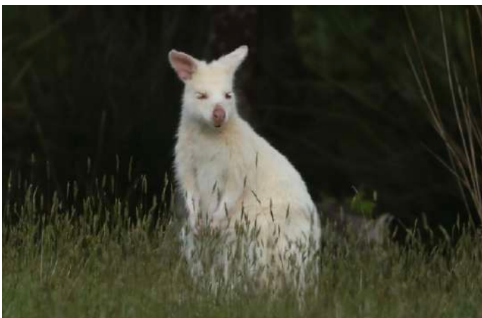
Bennet's Wallaby (vit form).

Efter frukosten gick vi på en liten promenad i Inalas fina botaniska trädgård som hade temat växter från juratiden. Förutom en massa fina plantor fanns det flera spännande djur inne i trädgården. Det var det lilla pungdjuret Tasmanian Dusky Antechinus och gnagaren Eastern Swamp Rat.