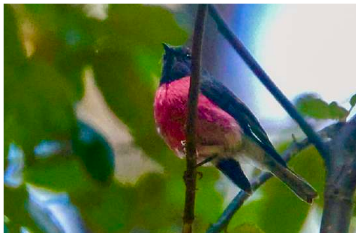
Pink Robin.

På kvällen hade vi en avskedsmiddag på vårt hotell. Vid artgenomgången därefter kunde vi konstatera att vi fått se alla av Tasmanien tolv endemiska fåglar och att vi haft mycket tur med pungdjuren. Totalt hade vi 136 arter fåglar varav 11 papegojor och 18 arter däggdjur. Resans fågel blev Southern Royal Albatross och självklart blev näbbdjuret resans djur.