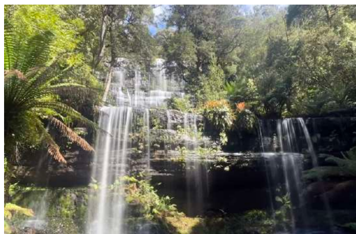
Mount Field National Park.

På tillbakavägen stannade vi till vid några vattendrag i hopp om att få se fler näbbdjur. Vi lyckades vid det sista försöket och fick då till och med se två näbbdjur. Återigen en succé med däggdjuren på denna resa.