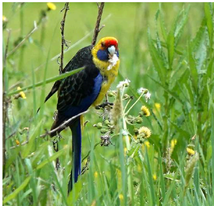
Green Rosella.

Under båtturen tillbaka såg vi Black-faced Cormorant och den stora Pacific Gull. Efter en kopp kaffe och glass for vi till vårt hotell som låg vid havet. På vägen dit stannade vi för ett myrpiggsvin som gick bredvid vägen. Här på Tasmanien har myrpiggsvin något som liknar päls på ryggen istället för långa taggar.