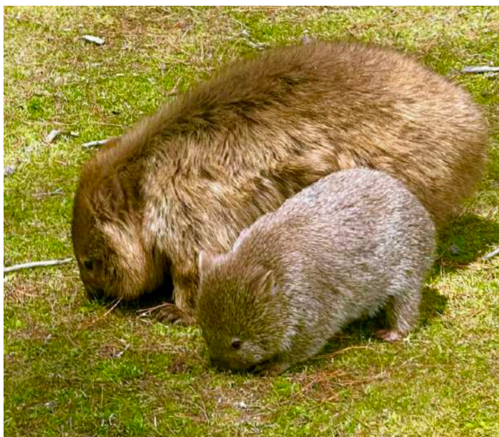
Wombat med unge.

Vårt sista skådarstopp blev vid en vadarlokal söder om Hobart. Där fick vi bland annat se Far Eastern Curlew, spetsstjärtad snäppa och sibirisk tundrapipare.