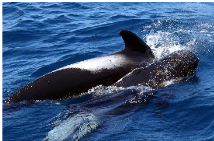
Long-finned Pilot Whale.

Efter att vi svalt den sista marängen åkte vi i skymningen till en strand där Little Blue Penguin kommer in från havet och går upp till sina bohålor. Det var kul att se hur bråttom de hade när de väl kommit upp på stranden. De var minst elva som sprang i rad.