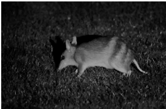
Eastern Barred Bandicoot.

Efter middagen åkte vi ut på ännu en tur i mörkret – denna gång för att leta efter den sällsynta Eastern Barred Bandicoot. Vi hittade minst sju stycken av det lilla randiga pungdjuret. Vilken däggdjurslista som vi har fått på denna resa!