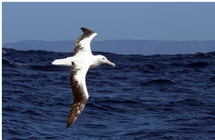
Southern Royal Albatross.

Idag var det dags att återigen åka ut till havs. Väderförhållanden var bra med lite vind på morgonen och sedan ökande vind. Vår båt låg bara fem minuter från hotellet och den visade sig vara relativt stor så att alla kunde sitta under ett soltak. När vi stävade ut såg vi Black Oystercatcher på stränderna. Till en början var det inte så mycket havsfågel men strax dök det upp Australasian Gannet och Short-tailed Shearwater. Den sistnämnda visade sig vara den vanligaste havsfågeln på turen med många, många tusen lror totalt. Vi hittade ett gäng knölvalar som fiskade tillsammans med Australian Fur Seal. Rätt så snart dök den första albatrossen upp som visade sig vara Shy Albatross – den vanligaste av de stora i dessa vatten. Vi såg mer än femtio stycken under dagen. Vi hade med oss fyra fågelskådare från Hobart och de blev extra glada när det dök upp en Buller's Shearwater eftersom de missat just den liran på tidigare havsfågelturer. När vi närmade oss kontinentalsockeln blev det allt fler havsfåglar, t ex vandringsalbatross, Southern Royal Albatross, Campbell Albatross, White-chinned Petrel och Sooty Shearwater.