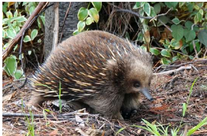
Short-beaked Echidna (myrpiggsvin).

Kort besök på besökscentret och sedan fika med cookies. Nästa stopp blev Tall Tree trail där vi fick se de högsta lövträden i världen – Mountain Ash – ett eukalyptusträd som kan bli över 86 meter högt. Där hade vi också fina obsar på Pink Robin.