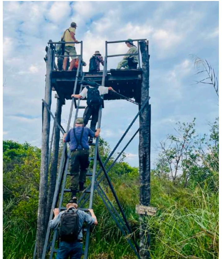
Torn för fladdermusskådning

som passerade tornet flera gånger. I skymningen fick vi ännu en gång uppleva fladdermössen dra iväg för att leta mat medan vi njöt av en sundowner och efteråt en trerätters middag tillagad på det enkla köket i vårt läger.