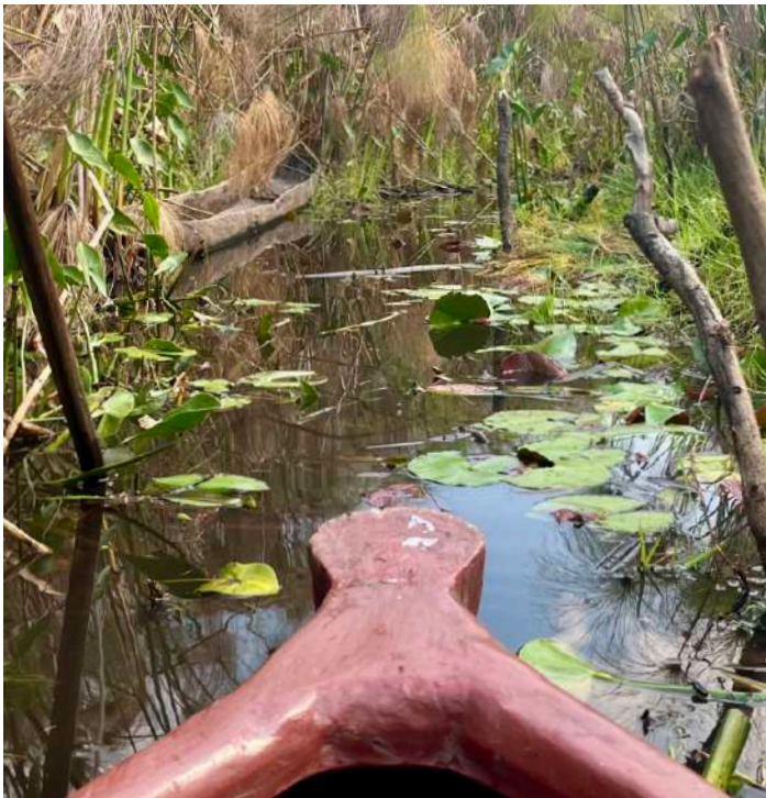
Färd i mokoro

Måndag 28 oktober – Bangweulu Wetlands. Frukost redan vid 05 och avfärd därefter. En av de första fåglarna vi träffade på var en Harlequin Quail som fick oss att kliva ur bilarna och ta en liten skogspromenad för att få se den bättre. Bra start på dagen! Efter flera timmar på knöliga vägar genom små byar kom vi till en liten utpost med parkvakter där vi lastade på en mokoro, kanot, på biltaket och fortsatte ytterligare några kilometer. Efter att ha parkerat bilarna klev vi ombord på kanoten två och två och fick skjuts genom papyrusvassen till andra sidan vattnet där vi ställde upp stolar och åt den medhavda lunchen. Planen var att leta efter Shoebill som setts i området dagen innan och till det hade vi hjälp av två lokala "spanare" som till och med klättrade upp i träd för att se ut över de stora slätterna och våtmarksområdena i närheten, men inte ens de lyckades hitta någon Shoebill idag. Däremot såg och hörde vi en del annat, som Little Bittern, Greater Swamp Warbler, Black Crake, Dusky Lark och Lizard Buzzard. Vi åkte kanot tillbaka genom papyrusen och med bilarna "hem" till vår lägerplats. Efter dagens strapatser var det riktigt härligt med en dusch och middagen smakade ovanligt bra.