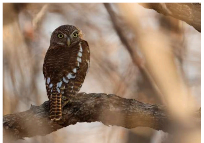
African Barred Owllet

Efter några timmar i bilarna kom vi fram till Luangwa River Lodge där vi åt vår medhavda picknicklunch och såg ett par Hamerkops med en unge vid den nästan uttorkade flodbädden. Vi fortsatte sedan ytterligare några timmar på slingrande vägar längs gränsen mot Moçambique innan vi så småningom nådde Katete. Där checkade vi in på Tivo Lodge, en enkel lodge som drivs av en ideell organisation. Standarden på boendet och middagen var enkel, men vi blev hjärtligt mottagna och fick lära oss lite om villkoren för den lokala befolkningen.