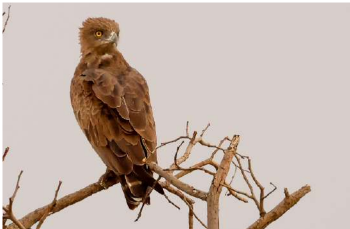
Brown Snake Eagle

Lördag 26 oktober – Mutinondo Wilderness. Den första stunden efter gryningen ägnade vi åt en liten promenad vid vårt tältläger högst uppe på kullen. Här hittade vi en hel del fina arter som Miombo Scrub Robin, Stierling's Wren-Warbler och Red-capped Crombec. Efter en stadig frukost packade vi ihop våra saker och lämnade Mutinondo. Vårt supportteam började ta ner tälten för att köra dem till nästa lägerplats. Vi körde genom den lilla nationalparken Lavushi Manda där vi stannade till vid bron över floden Lukulu och fick se en Half-collared Kingfisher blänka fint i blått när den flög alldeles nära oss och en Lesser Swamp Warbler som smög i vassen. Vi svängde av på en liten väg upp mot vattenfallet