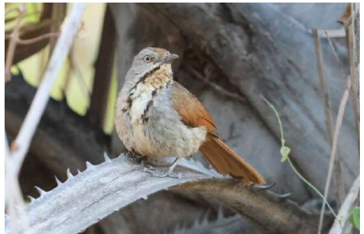
Collared Palm Thrush

På väg mot nationalparken stannade vi och köpte Baobab-frukter vid vägen för att kunna göra egen juice. Här såg vi en Common Myna, i det allra nordostligaste hörnet av sitt utbredningsområde i södra Afrika. Väl inne i parken började vi med att titta på ett stort bo där en stjärtpenna från en ruvande Crowned Eagle stack upp. Retz's Helmetshrike och Grey-headed Bushshrike sågs också i skogen intill. Vid en liten sjö kunde vi se en hel del arter som Intermediate Egret och Painted snipe. På girafferna vid vattnet satt Oxpeckers och de var gulnäbbade, till skillnad från de rödnäbbade vi sett tidigare. Fina arter som Greater Spotted Cuckoo och Verreaux's Eagle-Owl sågs på väg mot den stora kolonin med Southern Carmine Bee-eaters vid floden. Vi njöt av biätarna, flodhästarna, olika vadare och hägrar medan ljuset bleknade. Tre hyenor passerade och skrämde bort pukuantiloperna på