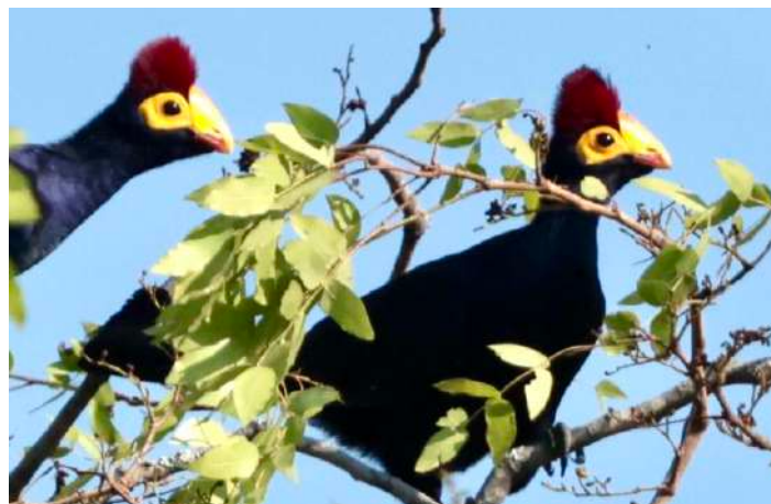
Ross's Turaco.

Vi fortsatte till vattenfallet Ndubaluba Falls och träffade längs stigen på några Anchita's Sunbird, som enbart finns i de östra delarna av Zambia. Under vandringen tillbaka uppför kullen svepte ett par korpar, White-necked Ravens, förbi.