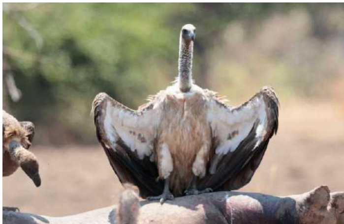
White-backed Vulture på flodhäst.

Dagens resa fortsatte sedan genom de mindre besökta delarna av nationalparken, på spännande vägar, genom sand och vatten, över en pontonbro och uppför en lång och brant stigning som tog oss upp till kanten av den förkastningsbrant som utgör nationalparkens norra gräns, och är en del av Afrikas Great Rift Valley och bjöd på en fantastisk utsikt. Under hela dagen mötte vi inte en enda bil. Efter att det mörknat hade vi turen att få se både en African Scops Owl och två Spotted Eagle Owls. När vi kom fram till dagens mål, Mutinondo Wilderness, hade redan den andra gruppen av AviFaunaresenärer anlänt, dvs Anita, PO, Christian och CG, och vi fick en stund tillsammans innan det var dags att installera oss i våra tält.