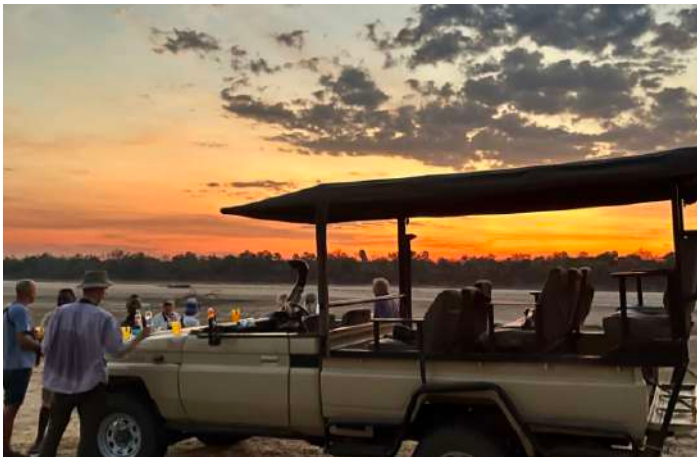
Sundowners vid Luangwafloden