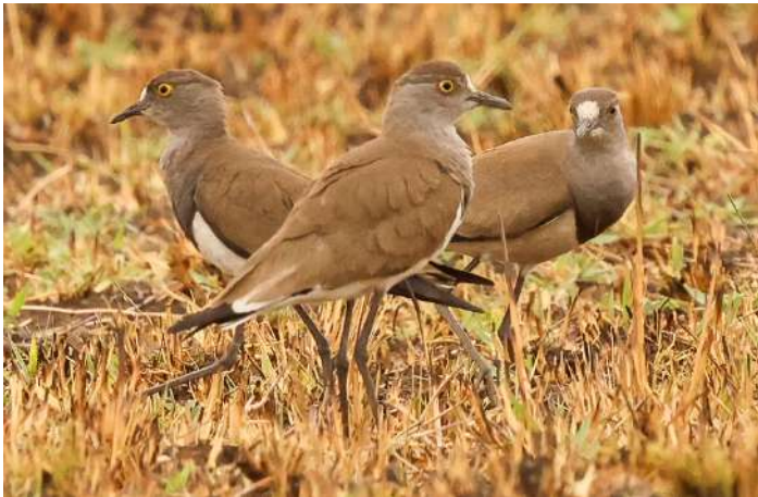
Black-winged (Senegal) Lapwing