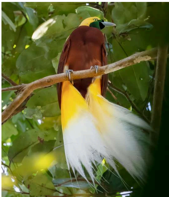
Lesser Bird of Paradise

24 augusti. Morgonskådning i Klasow Valley. Efter lunch återvänder vi till Sorong.