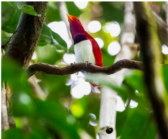
King Bird of Paradise

18 augusti. Tidig morgon med cirka 45 minuters körning till en spelplats för Wilson's Bird of Paradise. Här finns förstås mycket andra arter att skåda och vi intar vår medhavda frukost i skogen. Vi äter lunch på en restaurang och efter det skådar vi hela eftermiddagen, eventuellt blir det också lite nattskådning efter middagen.