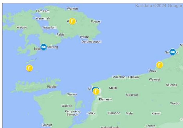
Fågellokaler under resan. Se dag-för-dagprogrammet.

Vattnen kring Raja Ampat anses som bland världens bästa för dykning/snorkling.