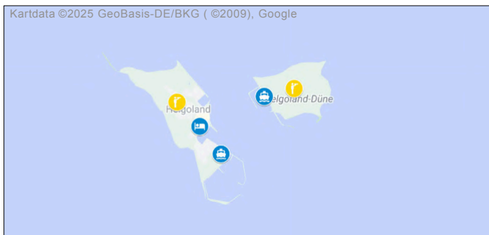
Fågellokaler under resan. Se dag-för-dagprogrammet.