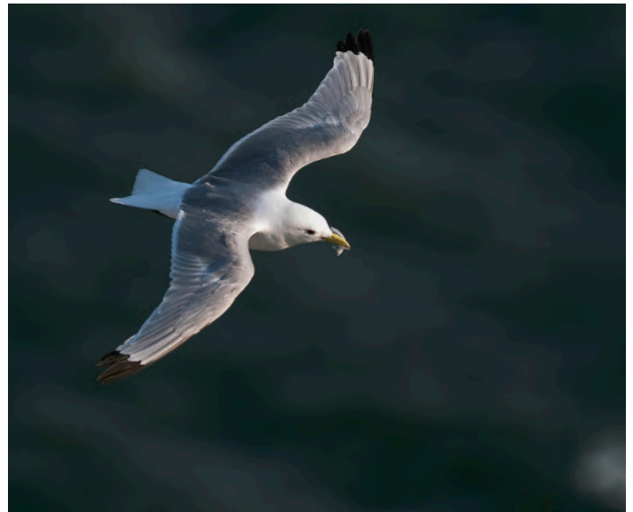
Tretåig mås.

27-29 maj. Skådning läggs upp efter väder och fågelrapporter. Någon dag åker vi över till grannön Düne och utforskar nya marker. Kanske vill någon tillbringa lite mer fototid vid havsfågelkolonierna eller ströva på egen hand.