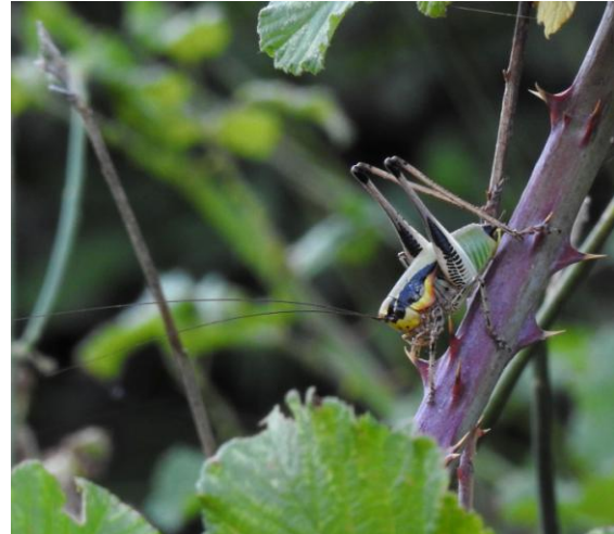
Eupholidoptera chabrieri . Elbasan Hill.

Nära Elbasan körde vi upp i bergen. Flera get- och får-flockar vallades av herdar bland de gamla knotiga olivträden som växt här i hundratals år. Svarthakade buskskvättor visade sig och vi fann också önskearten klippnötväcka, som till sist visade sig fint för hela gruppen. En mycket grann vårtbitare ( Eupholidoptera chabrieri ) sågs också fint. Innan vi lämnade bergsområdet hann vi se en ormörn som långsamt gled längs skogskanten.