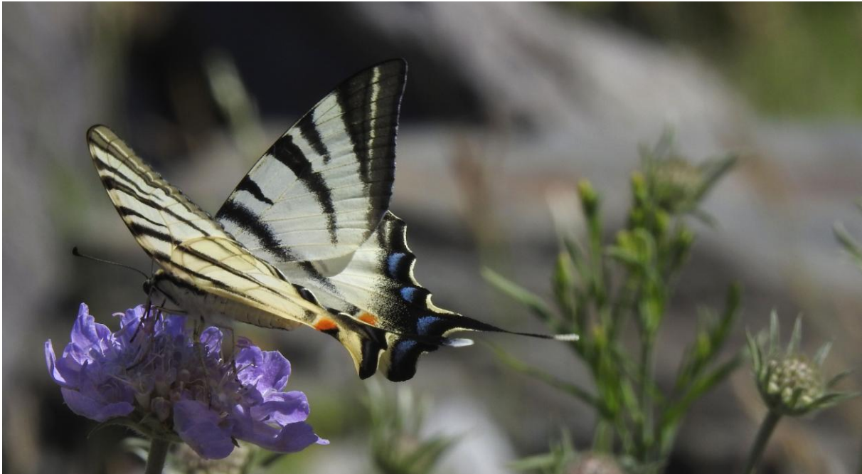
Podalirius , segelfjärilen, sågs ofta under resan.