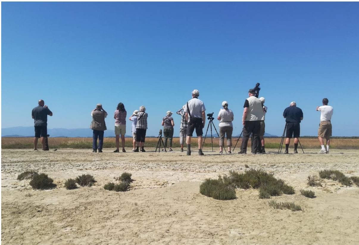
Vi spanar in tjockfotar i Nartasalinerna.