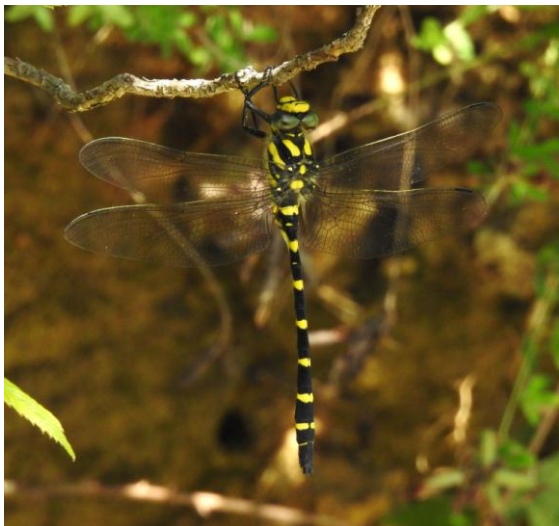
Balkan Goldenring.

rades vi god inhemsk mat och bjöds även detta år på den hemmagjorda rakin . Den smakade bra!