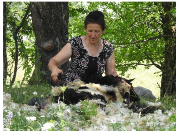
Fåren klipps. Theth-dalen.

Gruppen erbjöds lite olika alternativ för promenader under förmiddagen och fram över lunch. Ungefär halva gänget valde att åka till östra delen av dalen för en lite längre promenad tillbaka till Rozas hus, medan den andra halvan av gruppen promenerade i de centrala omgivningarna av byn. Det var fortsatt strålande väder men lite molnskyar höll den högsta temperaturen i schack så värmen blev aldrig så hög som under de tidigare dagarna.