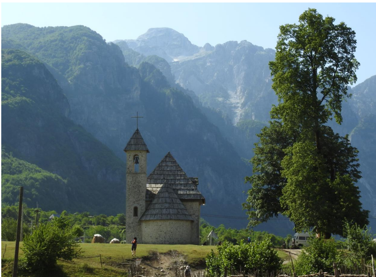
Kyrkan ligger centralt i Theth-dalen. Under kommunismen användes byggnaden som ett litet sjukhus och vår guide, Roza, föddes här inne.