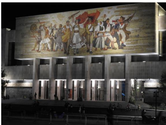
Nationalhistoriska museet i Tirana.

Efter lunch blev det skådning vid det gamla stenbrottet i passet. Här fann vi klippsvalor, blåtrastar och några häckspårvar. En hane medelhavstenskävta visade sig fint för oss. Långt nere i den turkosfärgade sjön fanns en familj smådoppingar. Trots det långa avståndet kunde vi tydligt följa de vuxna fåglarnas färd under vattenytan. Tänk så fort de simmade.