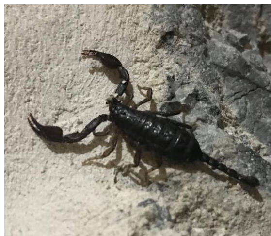
Skogsscorpionen ( Euscorpis italicus) vid vårt middagsbord i Theth-dalen.