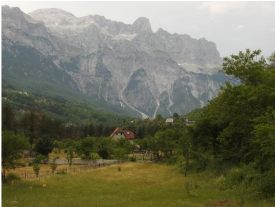
Theth-dalen ligger omgärdad av kraftfulla berg.

Så småningom nådde vi dalbotten och Rozas Guest house samt ett närliggande logi som huserade större delen av gruppen. Vi samlades för gemensam middag och artgenomgång hos Roza. Artgenomgången avbröts av en skogsscorpion ( Euscorpium italicum ) som kom smygandes på ena långväggen i matrummet. En läcker obs som fick avsluta en minnesrik dag med mycket intryck från naturen.