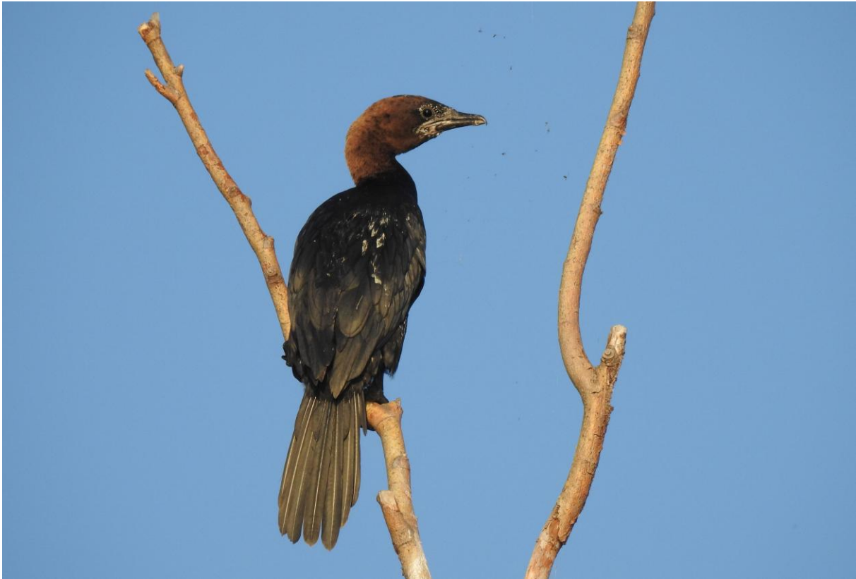
Dvärgskarv, vanlig i Lake Shkodër.