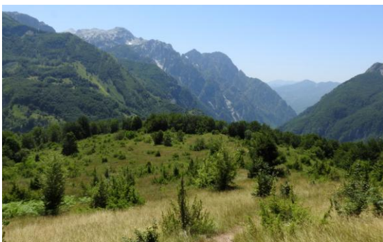
Den fina blomsterängen ovanför byn i Theth-dalen.

Det var dags för resans mest fysiska strapats då vi gemensamt promenerade upp mot Valbona-passet. Vi fick skjuts rätt så långt upp på sluttningarna och där vi klev av transporten kom lagom mörta vandrare som startat någon timme tidigare nere i byn. Mjukstart för oss alltså. Vi skulle dock snart. Li varse om vad som krävdes för att nå dagens högsta höjder. Vi på började snart stigningen uppför då vi stretade på genom en gammal hamlad bokskog. De största träden var krokiga och knotiga av många års beskärning. Så småningom nådde vi en fin blomsteräng som bredde ut sig över ett flera hektar stort område. Många fjärilar flög här, bl a flera exemplar av den granna Podalirius , segelfjärilen som är Europas största dagfjäril.