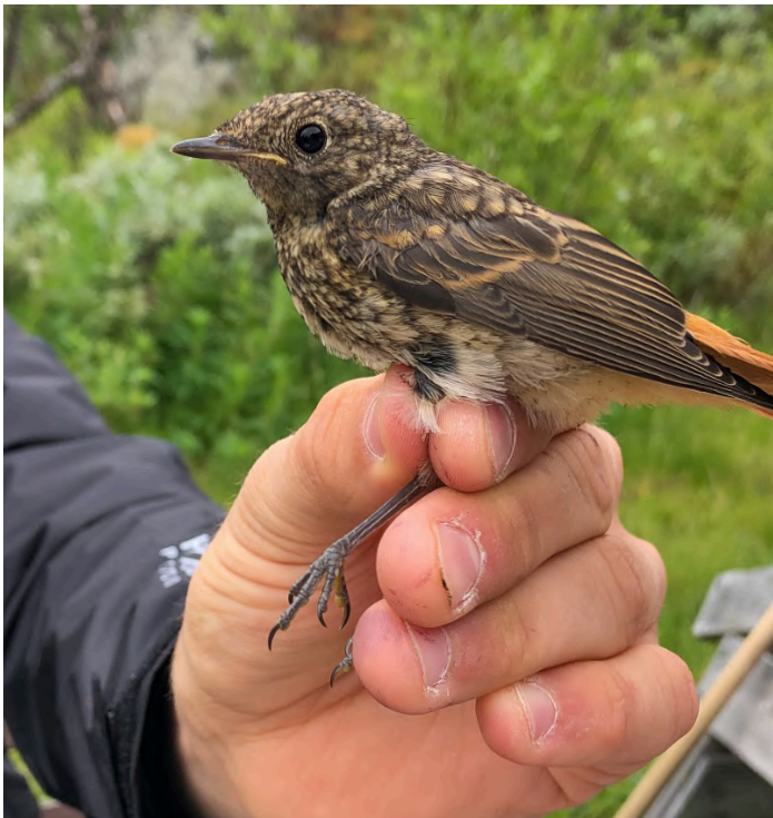
Ringmärkning av ung blåhake