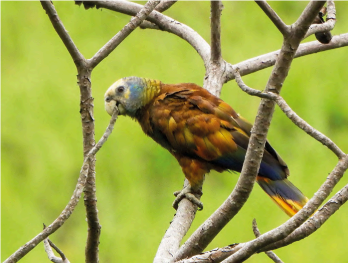
St Vincent Parrot

30 november. Redan klockan 04.00 lämnar vi hotellet, då vi hoppas se himlen förmörkas av St Vincent parrots. Det blir en lång körning till platsen som är otillgänglig, och vi skall bland annat korsa samma flod sju gånger på ditvägen. Men det är väl värt den tidiga uppstigningen och resan. Vi är tillbaka på hotellet till lunch och har lite tid för egna aktiviteter innan vi beger oss till flygplatsen och flyget till St Lucia. Här finns tid för lite sen eftermiddagsskådning innan middag. Natt på St Lucia.