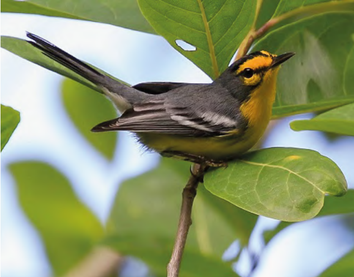
St Lucia Warbler

30 november. Redan klockan 04.00 lämnar vi hotellet, då vi hoppas se himlen förmörkas av St Vincent parrots. Det blir en lång körning till platsen som är otillgänglig, och vi skall bland annat korsa samma flod sju gånger på ditvägen. Men det är väl värt den tidiga uppstigningen och resan. Vi är tillbaka på hotellet till lunch och har lite tid för egna aktiviteter innan vi beger oss till flygplatsen och flyget till St Lucia. Här finns tid för lite sen eftermiddagsskådning innan middag. Natt på St Lucia.