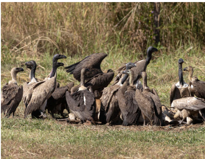
Slender-billed- och White-rumped Vulture

12 januari. Morgonen spenderar vi med att titta på tre arter gamar som kommer för att äta utlagt nötkött. Vi själva äter dock en anständig frukost på plats. Ett femtiotal individer av Slender-billed-, Red-headed- och White-rumped Vulture är inbjudna till festen. Efter lunch har vi tre timmars transport till Kratie och skådning i närheten för bland annat gyllensparv och Asian Golden Weaver.