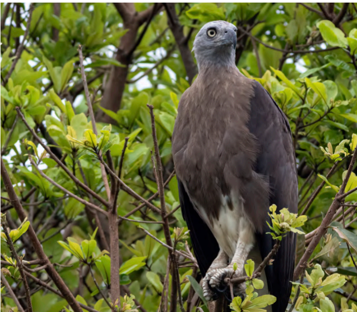
Grey-headed Fish Eagle

17 januari. En lite lugnare avslutning med en rundtur i staden där vi bland annat besöker the kungliga palatset, frihetsmonumentet m m. Hemresa på kvällen.