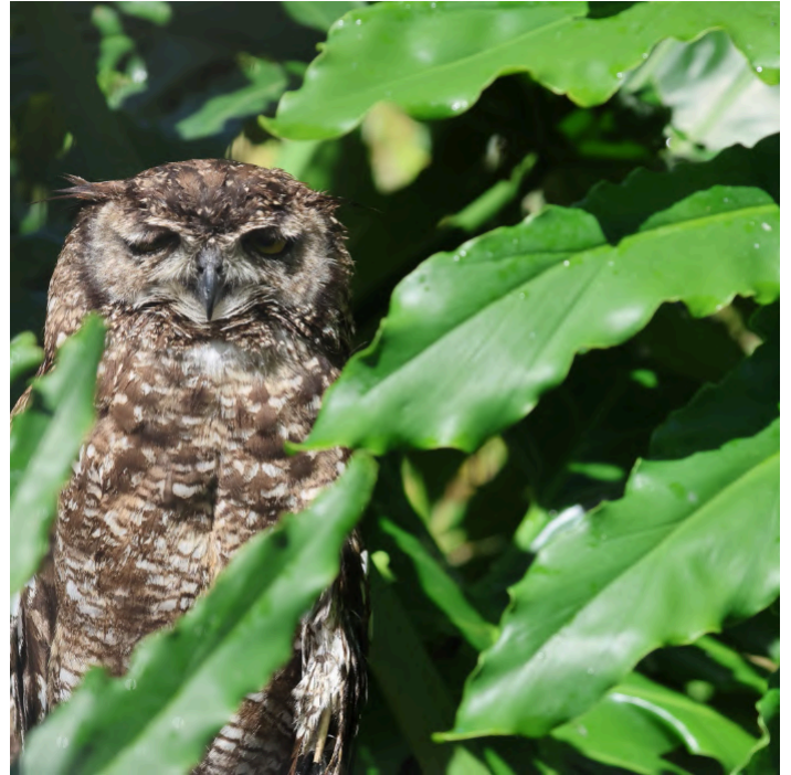
Spotted Eagle Owl