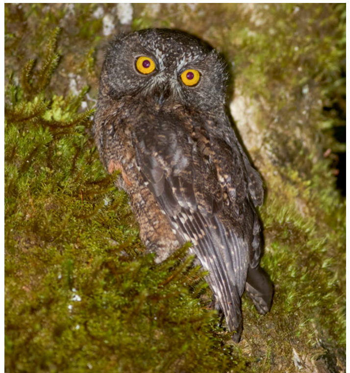
Karthala Scops Owl

Merlin Bird ID är en gratisapp med mycket användbar information som rekommenderas. Ladda ner fågelpaketet för aktuellt land eller region innan avresa.