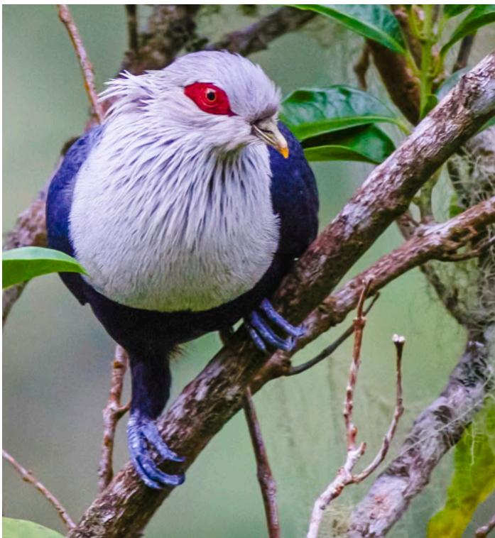
Comoro Blue Pigeon

Boka inte din resa innan du fått besked om tider från AviFauna först. I normala fall vet vi cirka 6 månader innan avresa de exakta mötestiderna om du reser utanför Europa. Om du reser inom Europa handlar det om 3 månader före avresa. Men det kan ske med kortare varsel och du blir i så fall meddelad detta. Om du bokat biljett själv utan klartecken från AviFauna kan vi inte ersätta dina kostnader ifall vi måste ställa in resan. Är den bokad efter klartecken från oss och vi ställer in ersätter vi kostnaden. Om du själv avbokar resan gäller avtalet mellan dig och flygbiljettsutställaren avseende flygbiljettens återbetalning.