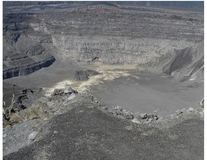
Kratern på toppen av Mount Karthala

3 november. Heldagsexkursion till Mount Karthala. Vi kör med 4x4-fordon upp till 1 700 meter och vandrar i en och en halv timme för att se den berömda endemiska Karthala White-eye. Vi vandrar ner genom primärskog för att se Karthala Scops Owl, Comoro Bulbul, Grande Comore Cuckoo-roller, Comoro Cuckoo Shrike, Comoro Thrush, Comoro Brush Warbler. Vi tillbringar hela dagen med att vandra på olika sluttningar av Mount Karthala, en aktiv vulkan och den högsta punkten på Komorerna. Berget är täckt av fuktig, eviggrön skog upp till nästan 1 800 möh. Högre upp består vegetationen av förvridna träd och hedmark. Vi kan köra cirka två tredjedelar av vägen upp till toppen av vulkanen och sedan gå resten av vägen (vanligtvis 1-2 timmar beroende på gruppens kondition) för att se kratern och fåglar i hedskogen. Karthala Scops Owl kräver att vi stannar i skogen tills det blir mörkt, och sedan går tillbaka till bilen. Mount Karthala är en IBA (BirdLife International: Important Bird and Biodiversity Area), och dess fågelrikedomar är verkligen spännande. Många av de nämnda arterna som finns på berget är endemiska för ön. Natt på Hotel Jardin de la Paix.