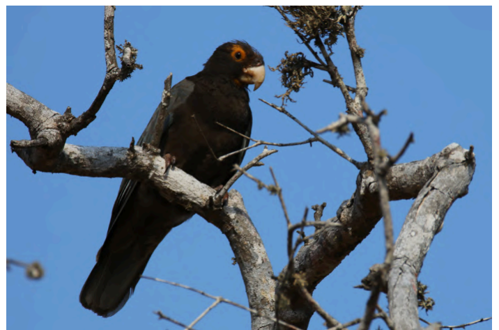
Greater Vasa Parrot

8 november. I dag fortsätter vi utforska Anjouan och dess endemiska arter: Anjouan Cuckoo Roller, Anjouan Sunbird, Pale Paradise Flycatcher med flera. Vi börjar med att återvända till Moya-skogen tidigt på morgonen och tillbringar dagen med fågelskådning i skogen där. Här kommer vi att leta efter Anjouan Brush Warbler and Anjouan Sunbird, liksom Frances's Sparrowhawk, Comoro Olive Pigeon, Comoro Blue Pigeon, Lesser Vasa Parrot, Olive Bee-eater, Crested Drongo, Malagasy Paradise Flycatcher, Malagasy White-eye, Comoro Thrush, Comoros Fody, Malagasy Harrier och, som alltid, många andra. Vi hoppas också kunna besöka en rastplats för Livingstone's Flying Fox, den mest sällsynta flyghunden i världen. Natt på Hotel a la Paillotte.