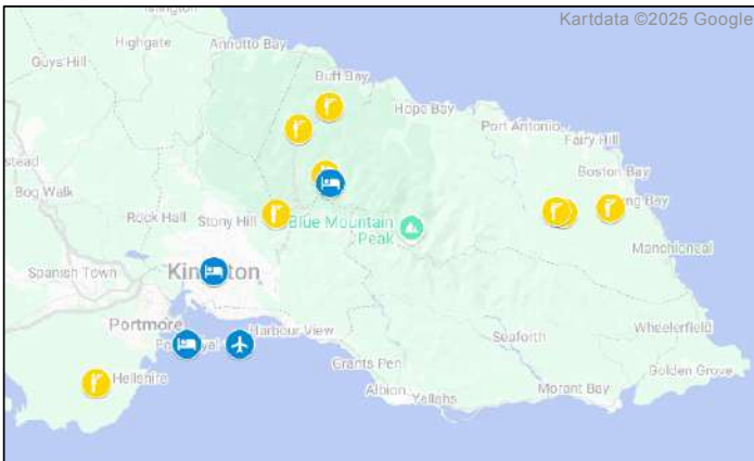
Fågellokaler under resan. Se dag-för-dagprogrammet på följande sidor.

Vi kommer se ett par av de äldsta europeiska bosättningarna i nya världen, höra mycket reggaemusik, äta karibisk jerk och spana ut över turkost vatten. Förutom fåglar kan vi glädja oss åt en mycket divers flora och ett gäng reptiler. Kaffet i Blue Mountains är världskänt och vi ska försöka besöka ett litet familjerosteri.