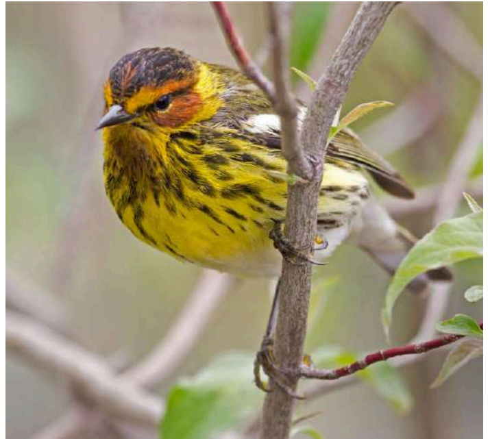
Cape May Warbler

20 mars. Transport till flygplatsen och flyg hem.