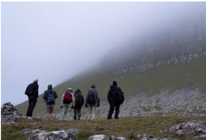
Framme vid stormsvalornas häckplats