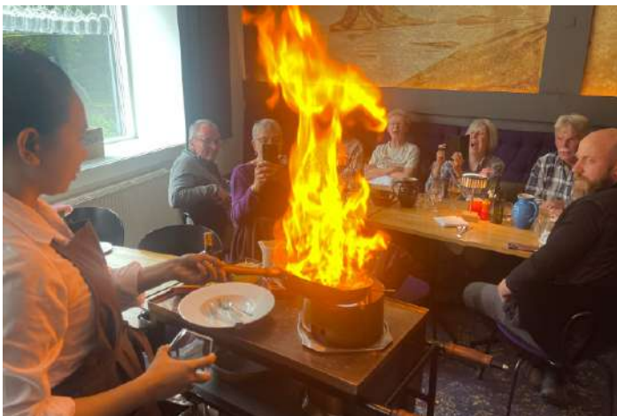
Flamberade crêpes till efterrätt

7 juli. Från det västligaste samhället på Färöarna tar man båten ut till ön Mykines. Ensam och hög reser den sig ur Atlanten. Runt dess klippiga kust flyger oräkneliga lunnefåglar, stormfåglar, kustlabbar och andra havsfåglar. Av oförklarliga skäl lyser solen mot oss även denna dag och termometern visar nära 20 grader. Regnställ, dunjacka och andra extrakläder åker ner i ryggsäckarna, vattenflaskor används flitigt. Den första storlabben får oss att jubla, men snart är de flera och den lokala guiden som visar turisterna runt på ön kliar sig i huvudet och undrar ”är det den här – som äter lunnefåglarnas ungar och attackerar våra får – som ni jublar över?” Runt ön glider även toppskarvar och havssulor, i gräset smyger skärpiplärkor och vid färjeläget får vi oväntat nog även in resans första gärdsmyg på denna karga ö, mitt ute i havet. På kvällen blir det en riktig lyxmiddag på en fransk restaurang med flamberade crêpes till efterrätt. Vi blir mätta, nöjda och trötta idag igen.