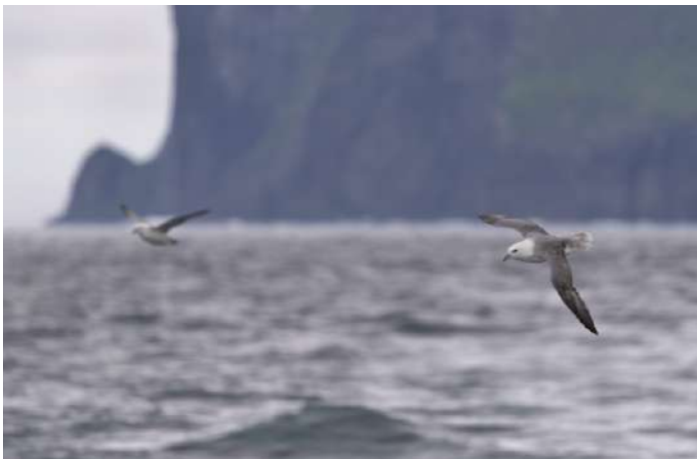
Stormfåglar vid Vestmanna

9 juli. Vi börjar dagen med att kliva på båten vid det lilla fiskesamhället Vestmanna, varifrån vi tar oss vidare ut på havet. Den nordvästra kuststräckan reser sig brant intill oss och överallt har havet nött ur håligheter och grottor i de massiva bergen. Flera hålor har blivit så stora att båten kan köra in i dem. På klippställarna häckar stormfåglar och alkor och överallt ovanför oss seglar fåglarna fram. Under turen ser vi även kust- och storlabb samt några tumlare som är uppe vid ytan med sina ryggar. På vägen tillbaka följer mängder av stormfåglar efter båten och de närmsta är nästan på klappavstånd.