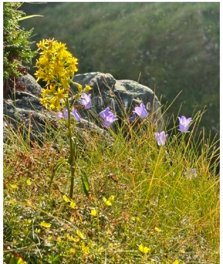
Gullris och blålockor.

Tack till deltagarna, Runde, det fina vädret och alla fåglar som bjöd på magnifika upplevelser!