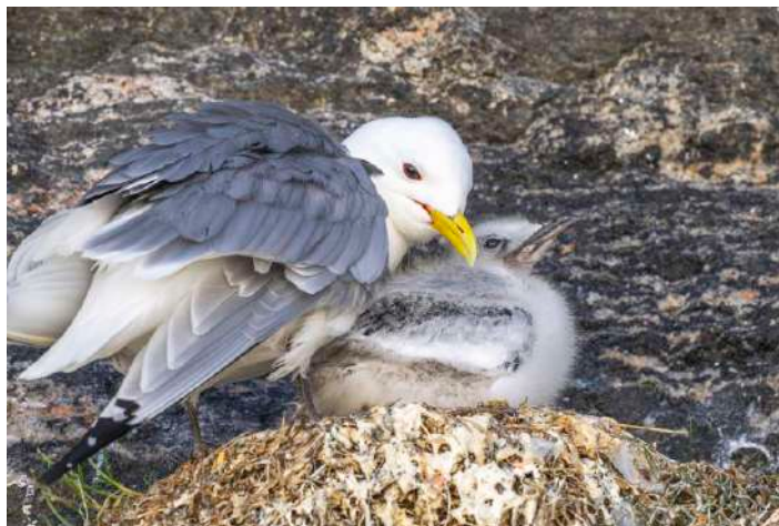
Tretåig mås.

Efter drygt två timmar återvände vi till hamnen och Miljøsentret för norska varianten av smørrebrød till lunch och efter det en välförtjänt siesta.