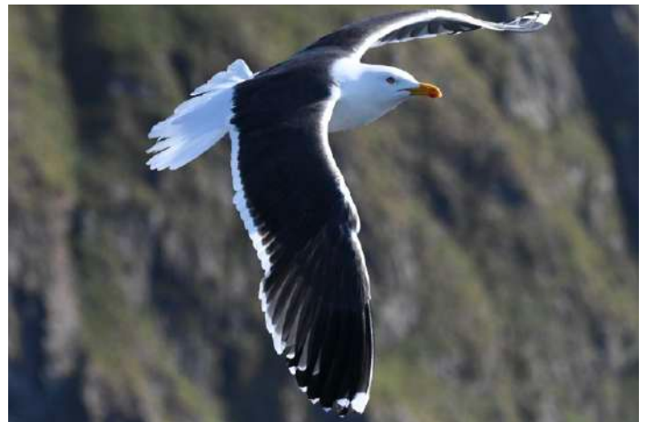
Silltruten som var ringmärkt 2013.

än sex ringmärkta trutar. Fem var gråtrutar ringmärkta mellan 2016 och 2022 men mest spännande var en silltrut ringmärkt i trakten 2013. Därefter har denna silltrut noterats tio gånger i Spanien och en gång i Skåne 2017!