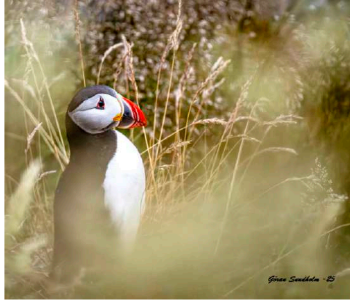
Lunnefågel. Foto: Göran Sundholm

Foto sid 1: Lunnefågel, Göran Sundholm. Fågelberget och gruppbild, David Armini.