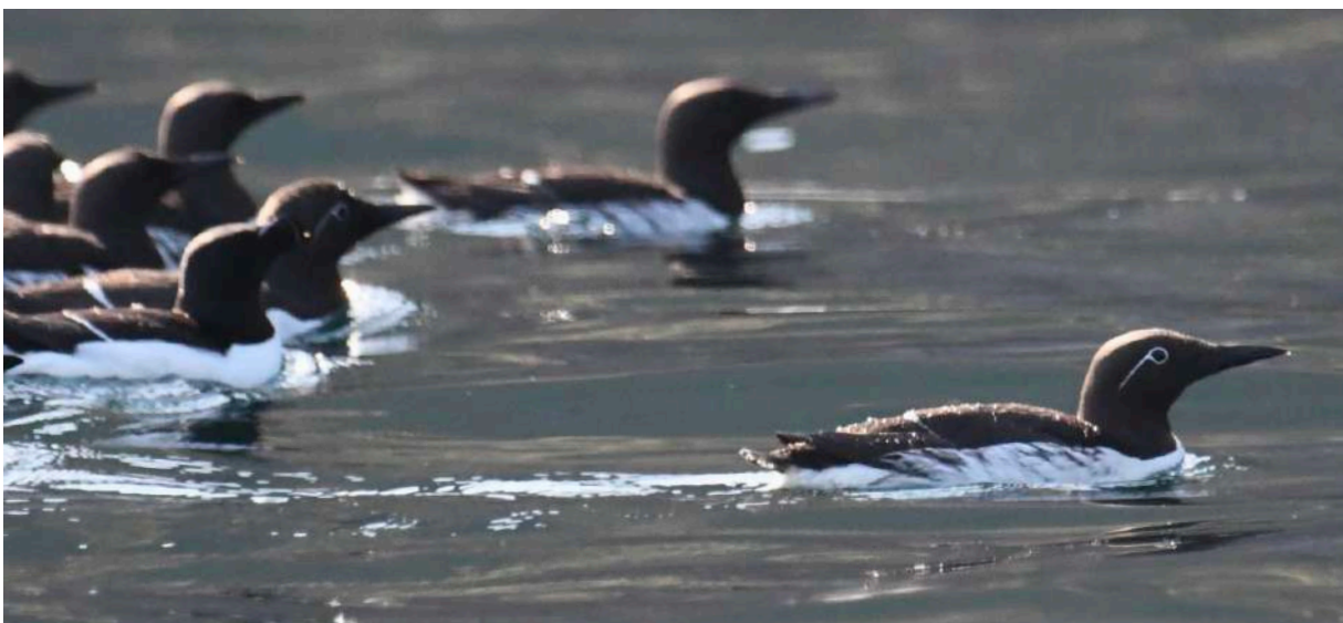
Sillgrisslor (inkl ringvia).