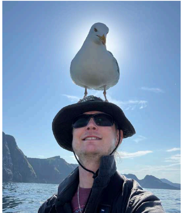
Selfie med gråtrut.