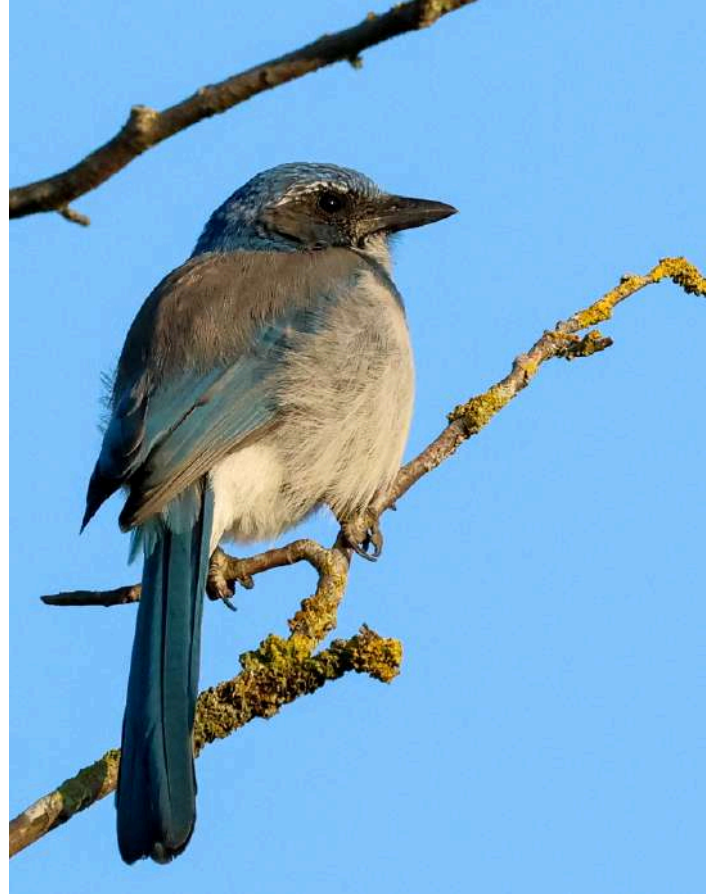
California Scrub Jay

Idag var det hemresedag, men vi hann ändå med ett par lokaler innan det var dags att åka till flygplatsen. Inte långt från hotellet dök en coyote, prärievarg, upp alldeles intill vägen! Dagens första stopp var nära Vancouvers stora hamn, där ett 20-tal American White Pelicans, hornpelikaner, stod en bit ut på den långsträckta lerstranden. Många Killdeers och en hel del skröntärnor fanns också på stranden. Vi såg hur en pilgrimsfalk slog en Green-winged Teal och sedan satt och åt på den. Vi fortsatte sedan till Centennial Beach vid Boundary Bay. Där tog vi en kort promenad vid stranden och tittade in i buskagen. Vi såg hej då till Chickadees och Yellow Warblers som vi sett på många ställen under resan. På väg tillbaka till bilen passerade tre snögäss över oss. Det var våra första av den mängd som under hösten kommer från sina arktiska häckningslokaler till Vancouver för att övervintra. En fin avslutning på en härlig resa!