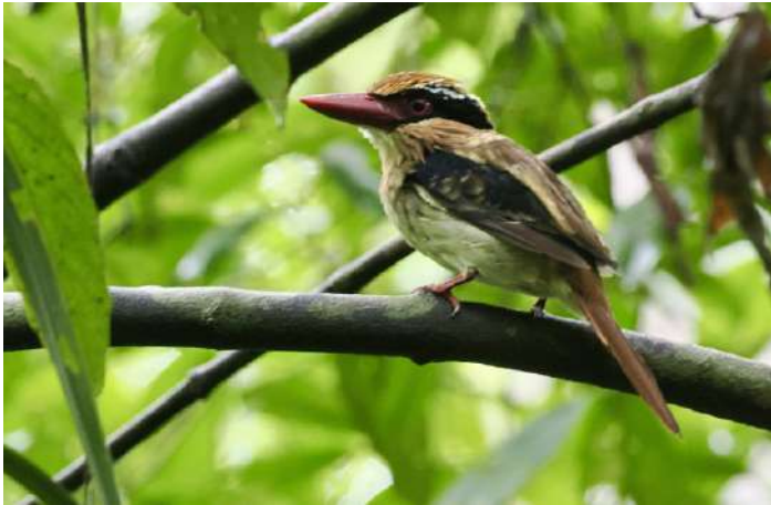
Sulawesi Lilac Kingfisher