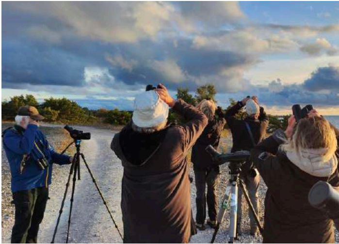
Morgonskådning vid Holmhällars klapperstensfält