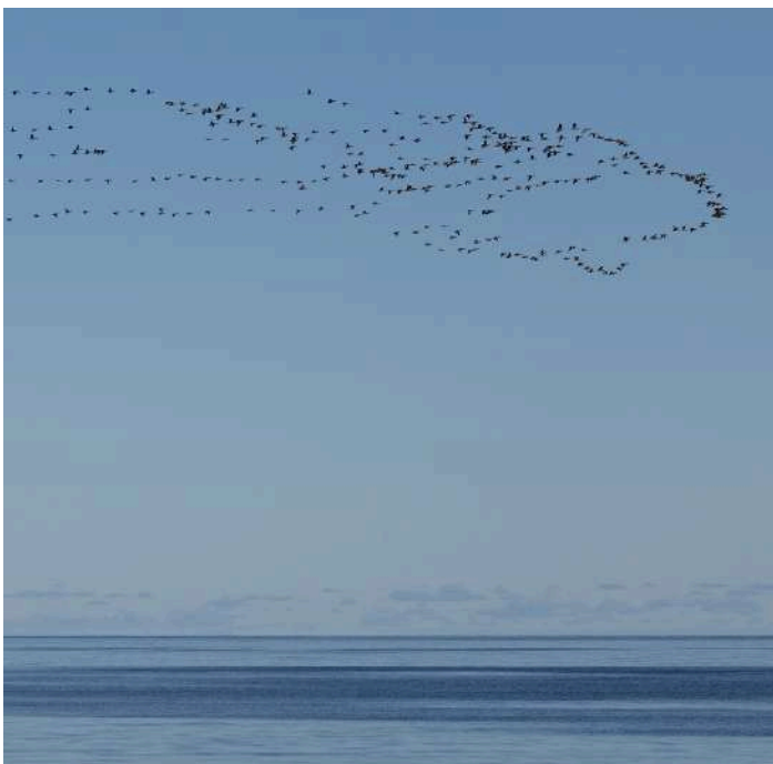
Prutgåsflöck med en hrota i fronten

Detta är en dag i kungsörnarnas rike och efter sju olika individer talas det om ”örnfrossa” i bilen. Vi får se kungsörnar i så gott som alla åldersklasser och några av dem kommer glidande alldeles ovanför vägen. En stor behållning.