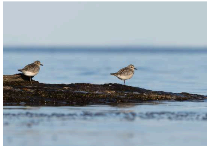
Kustpipare vid Auriv