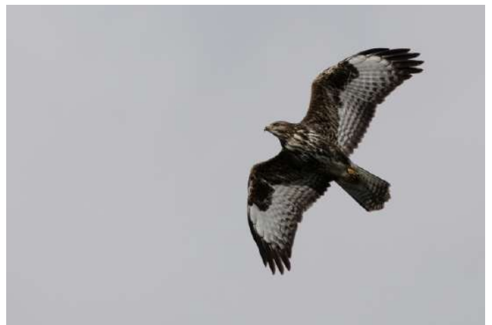
Gott om rovfåglar på resan, här en ormråk.

I Paviken är det annars framför allt simänder och sothöns. Men en havsörn sitter på span på fint avstånd och en enkelbeckasin kommer lite oväntat flygande.