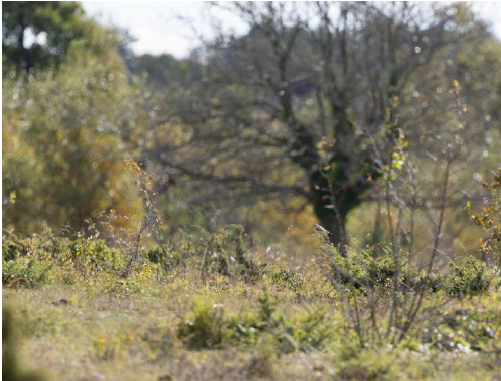
Ökenstenskväta i sista minuten