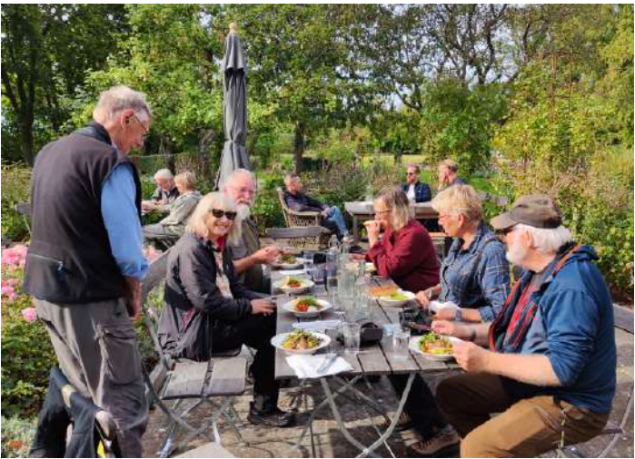
Lunch på Vamlingbo prästgård