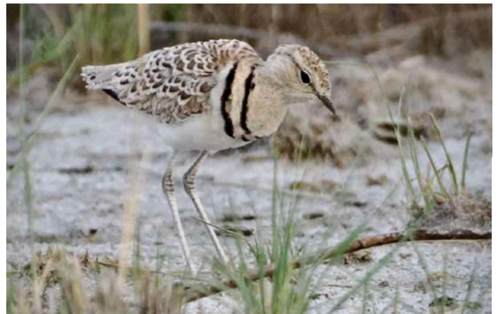
Double-banded Courser.

Mot kvällen återvände vi till Bird Sanctuary för att se solnedgången över vattnet och njuta av något kallt att dricka. Vid utsiktsplatsen var det lugnt och stilla tills en grupp kinesiska turister plötsligt dök upp, tog några snabba selfies i solnedgången och försvann lika snabbt igen. På väg tillbaka till lodgen flög en Spotted Eagle-Owl tvärs över vägen i strålkastarnas sken.