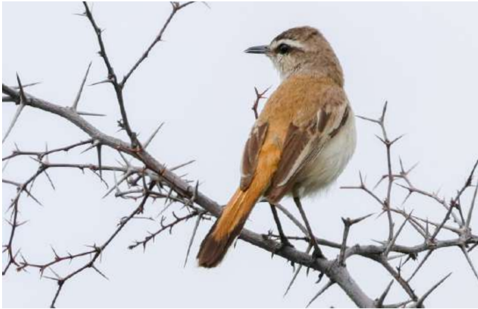
Kalahari Scrub Robin

enda gäster, vilket gav en mycket lugn och stillsam atmosfär. Framåt kvällen gav vi oss ut i lodgens game viewer. Vi såg en flock stora elandantiloper som korsade vägen och på flera platser även Oryx. En Red-crested Korhaan bjöd på en fin speluppvisning och vi hörde Kalahari Scrub Robin, en karaktärsart för området.