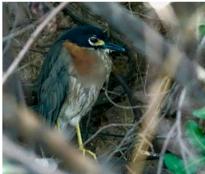
White-backed Night Heron.