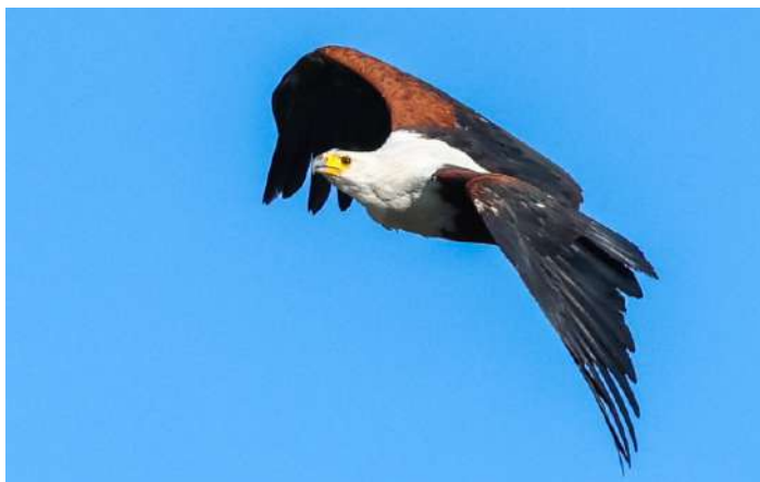
African Fish Eagle

Eftermiddagen ägnades åt skådning vid två intressanta platser i Kasane: Hot Springs och Sewage Works. Både Red-billed Teal och Blue-billed Teal simmade tillsammans med Ruff och Common Greenshank, som övervintrade här. Vi såg resans första Blacksmith Lapwings, en African Harrier-Hawk passerade över oss och en Little Bee-eater for runt i buskarna. På stadens soptipp stod mängder av Marabou Storks och Sacred Ibises. När skymningen närmade sig lämnade vi området, eftersom bufflar då ofta kommer ut ur skogen för att dricka vid floden och vi inte ville stå i vägen för dem. Dagen avslutades med middag och artgenomgång på hotellet.