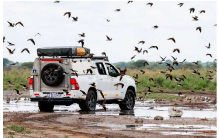
Black Winged Pratincoles

I gryningen hördes gnuer pusta och stänka utanför tälten, Spurfwowls skrånade och i sanden syntes många färska impalaspår. Efter en kopp kaffe körde vi mot Nxai Pan National Park. Strax efter att vi passerat grinden såg vi åtta Amur Falcons sittande i en buske vid vägen. Ett par Burchell's Sandgrouse sprang längs vägen och en flock oryx låg och vilade vid sidan. Vägen blev smalare och bitvis körde vi i djup sand, bitvis genom stora vattenpölar efter nattens regn.