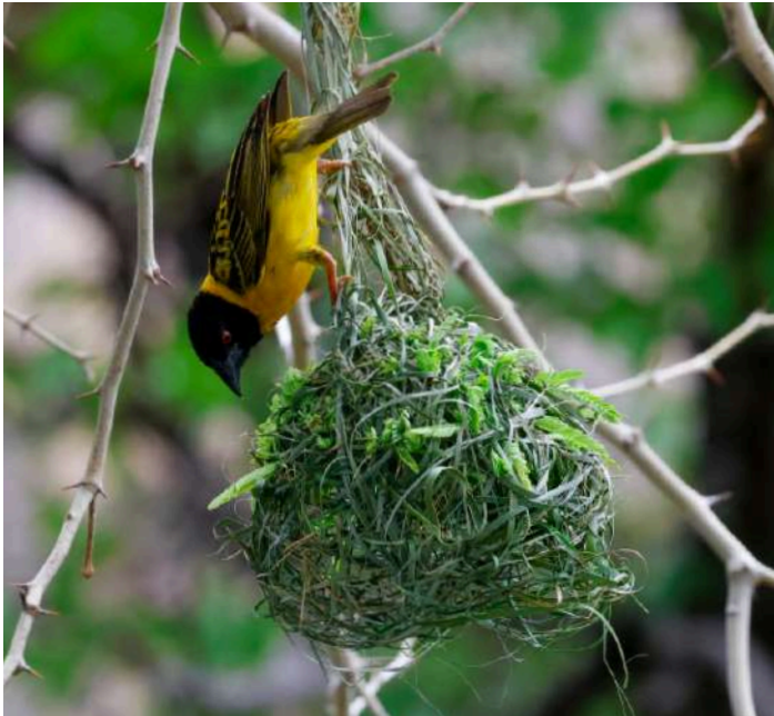
Southern Masked Weaver

Efter några timmars körning blev glädjen stor när vi hittade en entreprenör som sålde ”finkaffe” från egen odling vid vägkanten. Kaffet var riktigt gott och under stoppet såg vi även Little Swift och Red-breasted Swallow.