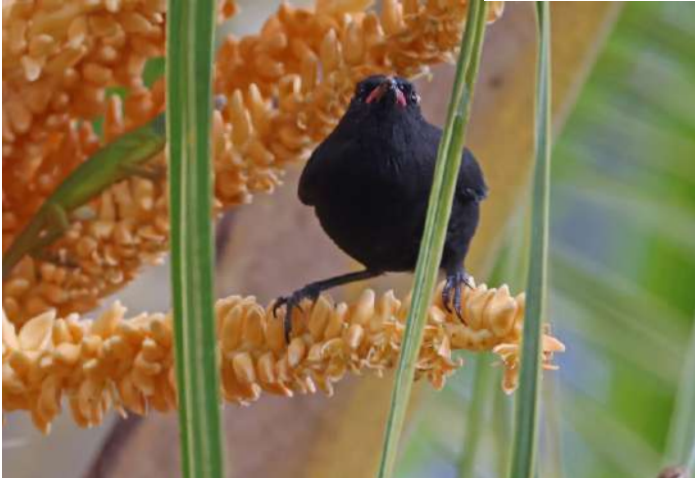
Bananaquit, black morph.