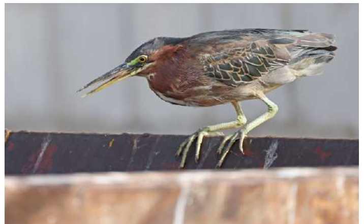
Green Heron.

Framme på flygplatsen såg vi Caribbean Martins komma in för övernattnig. Ca 500 hade hunnit ta plats under taket innan vi gick in genom säkerhetskontrollen.