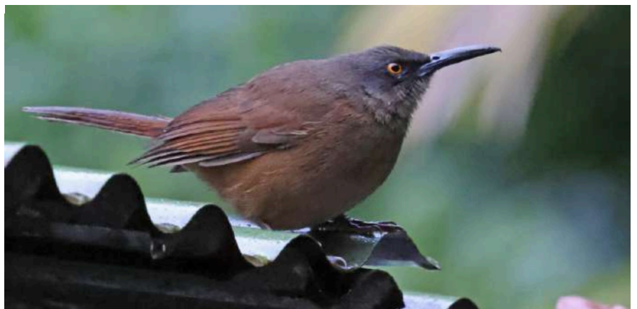
Brown Trembler.