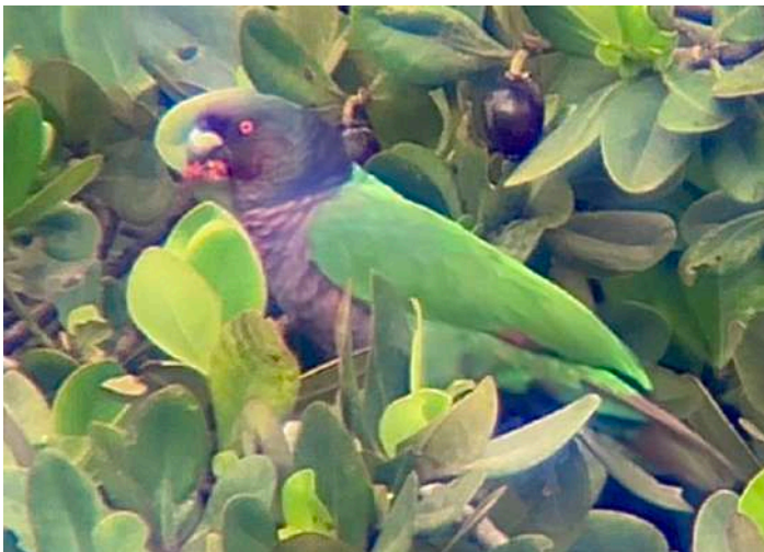
Imperial Amazon.

Nåväl, vi for tillbaka till utsiktspunkten och efter ytterligare en timma ropade Ryan ”a parrot”. Den lokala guiden Dr Birdy hittade den snabbt i ett träd med frukter och snart var den intubad. Yes! Imperial Amazon! Sittande fint dessutom. Den satt där och smaskade och vi kunde njuta av den tills alla var nöjda. Även en videosnutt dokumenterades. Populationen av denna fågel är mycket låg. Någonstans mellan 80 och några hundra individer, sågs det. Turligen är dess miljö svårexploaterad på grund av de branta och svårforcerade bergen, men en naturkatastrof skulle kunna utplåna populationen i ett slag. Det var ett gäng mycket nöjda svenskar som satte sig för att äta middag och göra artlista.