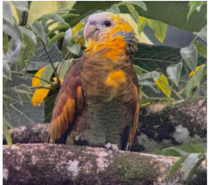
St. Vincent Amazon.

Lucia Warbler. Men bäst av allt är att vi fick se både den endemiska trupialen och gärdsmygen fint här. En Short-tailed Swift flög över och sen var det färd till hotellet, kanske det lyxigaste hittills, med stor pool och bra restaurang.