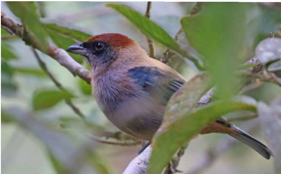
Lesser Antillean Tanager.