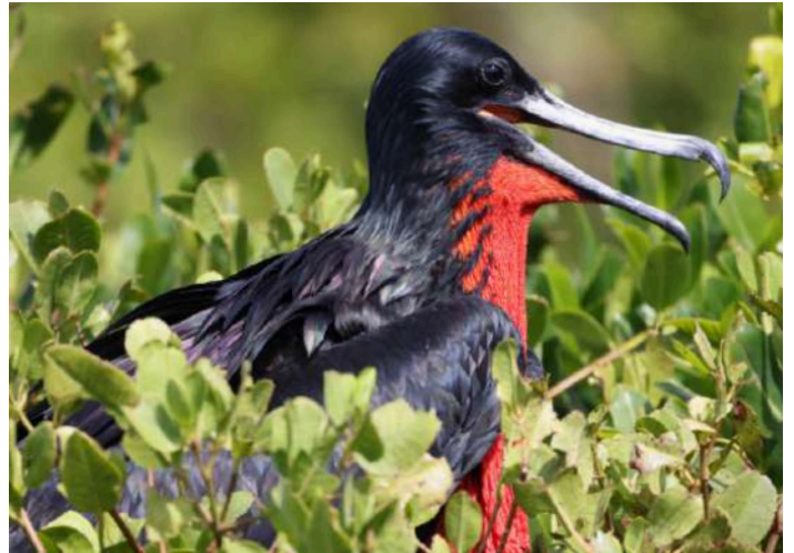
Magnificent Frigatebird.

Gemensam frukost intogs och efter sedvanliga avslutningsritualer for vi åt olika håll. Några av oss till Trinidad, några hem via London och andra stannade en natt till. En mycket häftig resa fullspäckad med upplevelser och intryck var till ända.