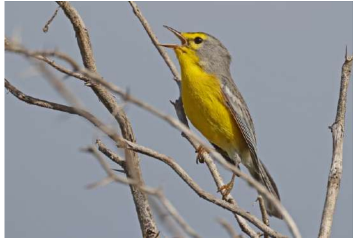
Barbuda Warbler.

Nästa aktivitet var att med en liten utombordare ta oss till en fregattfågelkoloni. Vi kom alldeles nära in på fåglarna och när färjkarlen stängde av motorn så hörde man ett högljutt klappande och knorrande. I sanning en magnifik ljudmatta. Efter lite foton och ljudinspelning fortsatte vi till Pink Beach där några av oss svalkade oss i det turkosa havet.