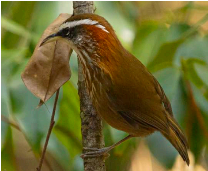
Streak-breasted Scimitar Babbler.

Hela morgonen på en fin stig genom Fuzhuo National Forest Park alldeles i utkanten av stan. Fin stensatt promenad och det var tydligen ett populärt utflyktsmål för lokalbefolkningen också. Lite irriterande att lokalbefolkningen går omkring i skogen med en högtalare med musik! Vi såg en hel del fåglar ändå och eftersom det var första besöket i skog så var nästan allt nytt. Tristram's Buntings, Streak-breasted- och Gray-sided Scimitar Babblers och några blommande träd fulla med Fork-tailed Sunbirds var bara några av höjdpunkterna. Efter lunch blev det sedan lång transport till Ming Xi-området där vi blev inkvarterade i en lodge i en liten by. Efter middagen åkte vi iväg till en sjö där vi bordade en pråm med campingstolar för en nattexkursion. Mountain Scops Owl sjöng från flera håll och himlen var stjärnklar men det var också kallt. Vi värmdes dock av flera obsar av den sällsynt White-eared Night-Heron där den sista snällt stod kvar på stranden och sedan flög upp i ett träd och vi hade således walk-away views av den.