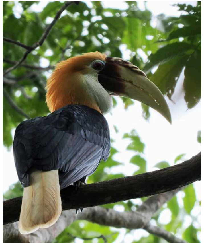
Blyth's Hornbill.

Det var dags att utforska låglandsregnskogen längs den nordvästra delen av Vogelkop-halvön och vår slutdestination för dagen var kuststaden Sausapore, ca 100 kilometer nordost om Sorong. Vägen dit går genom den artrika Klasowdalen och i detta område skulle vi komma att tillbringa hela morgonen och förmiddagen. Vi lämnade hotellet mycket tidigt om morgonen för att komma fram i tid innan det blev för varmt. Vi körde på den så kallade Makebon Road till dess att vi nådde det lilla samhället Klabili. Här finns det ett litet Eco-community med homestay och mycket duktiga lokalguider som känner skogen väl. Man har dessutom byggt en spång in i skogen vilket ökar tillgängligheten. Vid vår ankomst kunde ett större antal av Mountain Swiftlet ses födosöka över byn. Orange-bellied Fruit Dove, Long-tailed