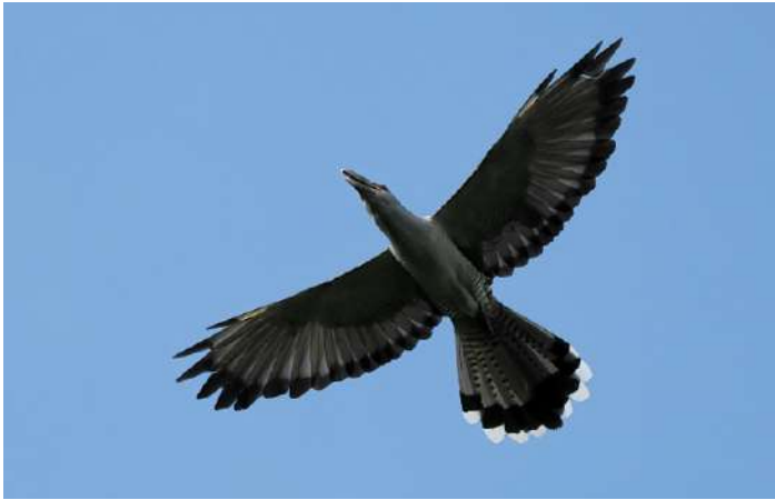
Channel-billed Cuckoo.

Vi nådde ett gömsle efter en kortare vandring och initialt fick några av oss en snabb obs av hanen, sen var det mest honan som visade sig. Men även honan är en udda fågel, trots att den saknar de flesta av hanens spektakulära färger och egendomliga stjärtspröt. Trots att vi tålmodigt väntade ville hanen inte behaga visa sig tillfredställande för alla, men vi skulle få en ny chans senare. En Papuan Dwarf Kingfisher dök upp alldeles framför oss i gömslet och visade sig fint för de flesta i gruppen. På vägen tillbaka längs stigen noterade vi såväl Raja Ampat Pitohui som Black-sided Robin. Efter att ha återvänt till resorten för lunch och siesta ägnade vi den sena eftermiddagen åt att utforska skogskanten till fots längs huvudvägen i närheten. Den stora och spektakulära göken Channel-billed Cuckoo noterades överflygande och vi kunde avnjuta sittande Claret-breasted Fruit Dove. Vi hade även turen att få uppleva den mycket säregna spelflykten hos Glossy-mantled Manucode med vingslag i slow-motion, något som är få förunnat. Den franska naturforskaren och zoologen René-Primevère Lesson beskrev denna art i början av 1800-talet och det blev därmed den första arten av paradisfågel som beskrevs i det vilda av en västerlänning. Efter middagen gjorde några av oss en "night-walk" i de nära omgivningarna. Hook-billed Kingfisher hördes och med