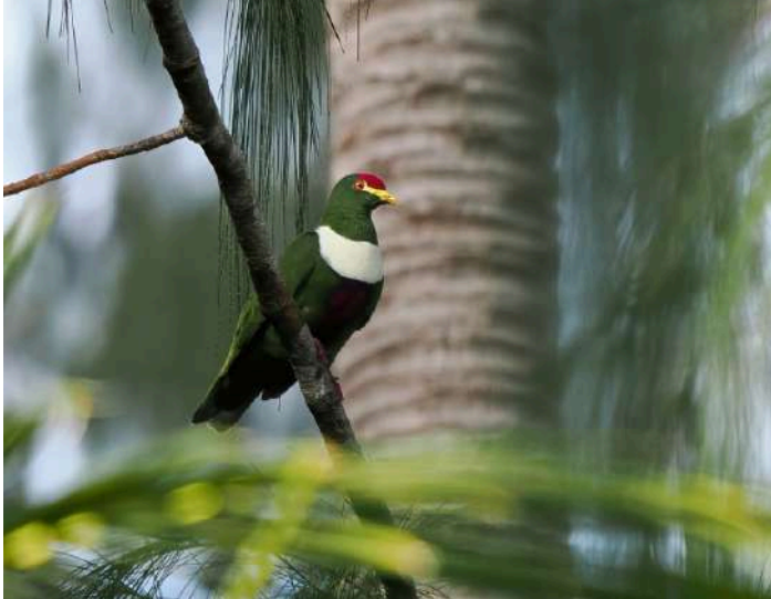
White-bibbed Fruit Dove.