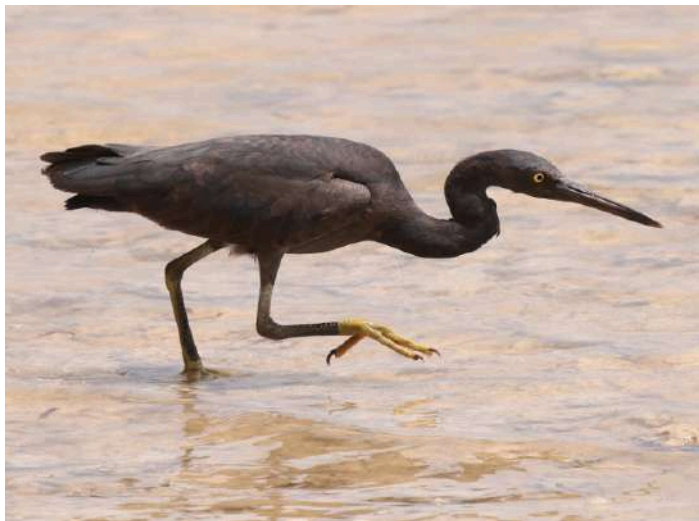
Pacific Reef Heron

Bland dessa hittade vi även Barn Swallow (ladusvala), gissningsvis tillhörande någon av raserna från östra Centralasien. Även fina obsar av den robusta men rätt sval-lik White-breasted Woodswallow liksom Oriental Dollarbird. Framåt skymningen drog flockar av Metallic Starling förbi, sannolikt på väg till någon övernattningsplats i närheten.