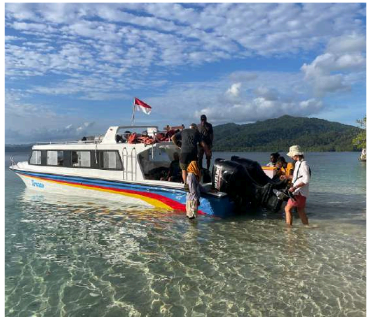
Little Urai Island