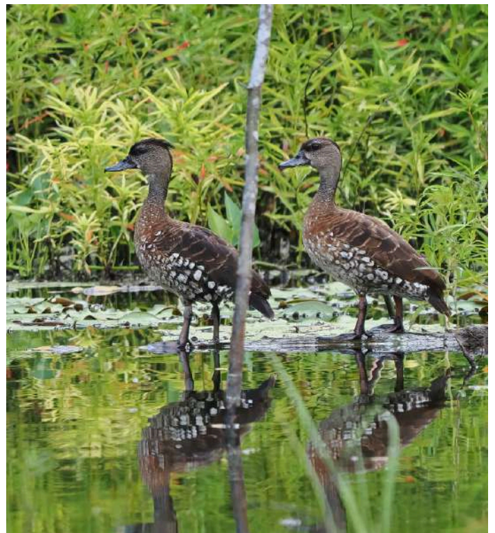
Spotted Whistling Duck.

På vår vandring från gömslet tillbaka till bilarna hittade en av de otroligt skarpögda lokalguiderna en Western Crowned Pigeon som satt högt upp i ett träd längs stigen. Yellow-billed Kingfisher samt Common Paradise Kingfisher hördes inne i skogen och den senare sågs som hastigast. Även en Yellow-bellied Longbill sågs tillfälligt. Den sena eftermiddagen ägnades åt några lokaler i närheten av öns lilla flygplats. Vid en mindre våtmark fanns resans enda art av and i form av Spotted Whistling Duck. Vägskådning i kanten av regnskogen men med en något annorlunda komposition av habitat jämfört med tidigare gav Dwarf Fruit Dove, Green-backed Gerygone, Boyer's Cuckooshrike, Grey-headed Cuckooshrike och Brown Oriole. I en park inne i Waisai blev Eastern Yellow Wagtail (beringärla) och Eastern Cattle Egret nya arter för resan. I samband med middagen på kvällen gjorde reseledaren slag i saken att försöka se den Papuan Boobook som hade hörts föregående kväll och efter en stund visade den sig i ficklampans sken högt upp i en palm. Detta blev resans enda ugglear. Vi gjorde därefter en ny "night-walk" alldeles i närområdet av resorten och nu fick vi riktiga närobsar i ficklampans sken på både Marbled Frogmouth och Papuan Frogmouth, vilka märkliga fåglar! Även en Northern Common Cuscus sågs högt uppe i trädkronorna.