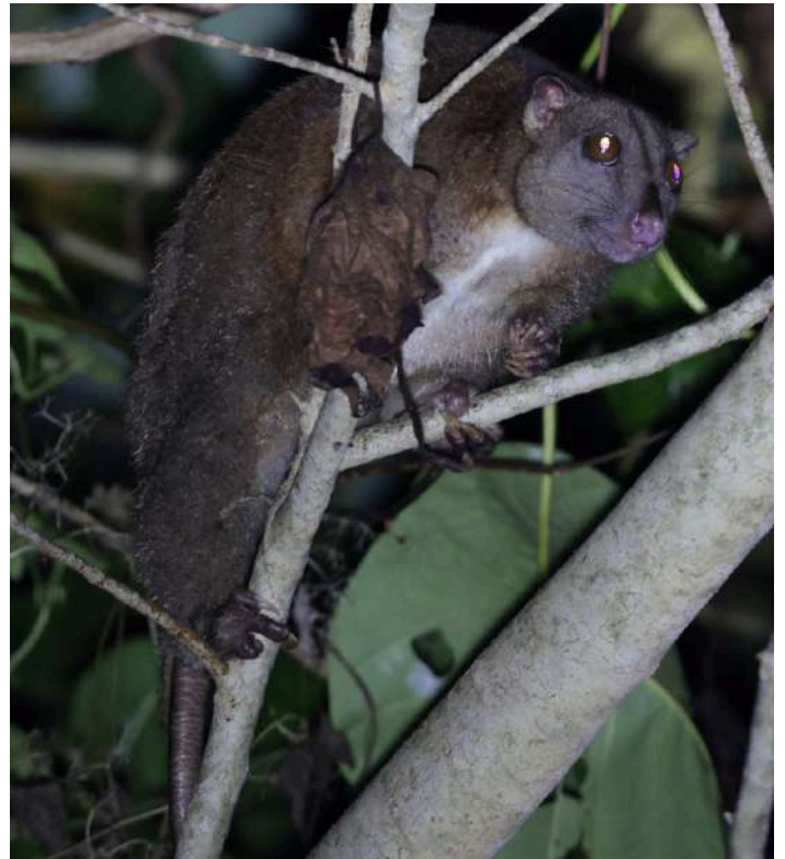
Northern Common Cuscus