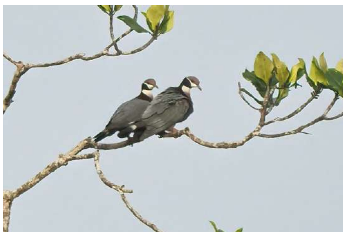
Collared Imperial Pigeon.

Västpapua är en del av Indonesien och utgör den västra halvan av ön Nya Guinea. Området var tidigare nederländskt men överläts sedermera till Indonesien. Beläget väster om Papua Nya Guinea och geografiskt en del av den australiska kontinenten, ligger området nästan helt på södra halvklotet och inkluderar ögrupperna Biak och Raja Ampat. Västpapua har en omfattande skogsareal och cirka 90 % av regionens yta är täckt av regnskog. Fågelsamhällena i Nya Guineas skogar skiljer sig markant från andra områden i världen genom en ovanligt hög andel arter som livnär sig på frukter och nektar samt marklevande arter. Australo-Papuanska tättingar har utvecklats för att fylla alla tillgängliga ekologiska nischer. Särskilt intressanta är förstas paradisfågarna där vi på den här resan fick se och uppleva fem olika arter och där kanske Wilson's Bird-of-paradise får anses vara den mest eftertraktade av dem alla. Den finns endast på öarna Waigeo och Batanta i den legendariska Raja Ampat-arkipelagen och arten har ofta utsetts till en av världens mest spektakulära fågelarter.