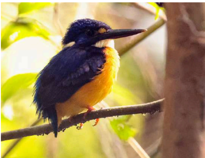
Papuan Dwarf Kingfisher

Vi nådde ett gömsle efter en kortare vandring och initialt fick några av oss en snabb obs av hanen, sen var det mest honan som visade sig. Men även honan är en udda fågel, trots att den saknar de flesta av hanens spektakulära färger och egendomliga stjärtspröt. Trots att vi tålmodigt väntade ville hanen inte behaga visa sig tillfredställande för alla, men vi skulle få en ny chans senare. En Papuan Dwarf Kingfisher dök upp alldeles framför oss i gömslet och visade sig fint för de flesta i gruppen. På vägen tillbaka längs stigen noterade vi såväl Raja Ampat Pitohui som Black-sided Robin. Efter att ha återvänt till resorten för lunch och siesta ägnade vi den sena eftermiddagen åt att utforska skogskanten till fots längs huvudvägen i närheten. Den stora och spektakulära göken Channel-billed Cuckoo noterades överflygande och vi kunde avnjuta sittande Claret-breasted Fruit Dove. Vi hade även turen att få uppleva den mycket säregna spelflykten hos Glossy-mantled Manucode med vingslag i slow-motion, något som är få förunnat. Den franska naturforskaren och zoologen René-Primevère Lesson beskrev denna art i början av 1800-talet och det blev därmed den första arten av paradisfågel som beskrevs i det vilda av en västerlänning. Efter middagen gjorde några av oss en "night-walk" i de nära omgivningarna. Hook-billed Kingfisher hördes och med