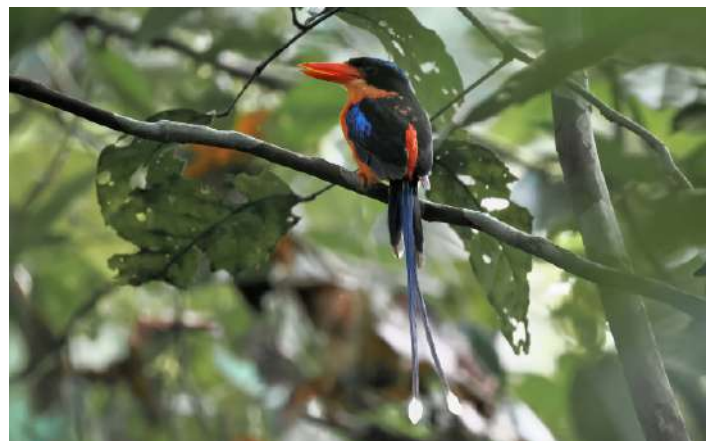
Red-breasted Paradise Kingfisher.