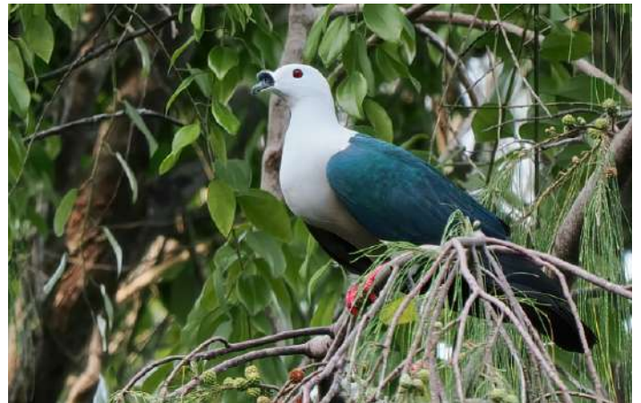
Spice Imperial Pigeon.

Nästa dag var en heldag som ägnades åt övärlden en bit ut i havet utanför vårt boende. Tidigt om morgonen lämnade vi resorten på en snabbgående motorbåt för att ta oss ut till ön Merpati som är en liten isolerad och obebodd ö med några specialarter som vi inte skulle ha chans att se någon annanstans. Det höga tidvattnet gjorde att båten precis kunde ta sig över korallrevet som omgav ön. Vi möttes av en fin tropisk sandstrand kantad av kokospalmer. På ganska kort tid lyckades vi här notera ett antal nya arter för resan. Dusky Megapode lät inifrån skogen och Spice Imperial Pigeon kunde beskådas sittande högt upp i träden liksom White-bibbed Fruit Dove ("Moluccan Fruit Dove"). I några Casuarina-träd hittades födosökande Violet-necked Lory och Moluccan Starling sågs inne i skogen där de födosökte på små frukter. Andra nämnvärda nytillskott var Varied Honeyeater, Olive Honeyeater och Supertramp Fantail.