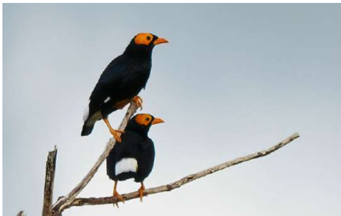
Yellow-faced Myna.

Det var dags att lämna Waigeo och ta färjan tillbaka till Sorong. Återigen sågs flera av Bulwer's Petrel (spetsstjärtad petrell) ute på det öppna havet och nu även Wedge-tailed Shearwater. Då vi närmade oss Sorong uppmärksammades några avvikande tärnor ståendes på "driftwood" och dessa kunde efter fotogranskning bestämmas till Aleutian Tern (beringtärna), ett ganska oväntat fynd! Arten häckar på båda sidor av Berings Sund och vinterkvarteren är till stora delar okända, även om den under flyttningen siktats i Malaysia och delar av Indonesien, bland annat i Bandahavet. Även en Roseate Tern (rosentärna) fotograferades vid samma tillfälle och kunde artbestämmas vid fotogranskning i efterhand. Efter att återigen ha checkat in på vårt lyxiga hotell i Sorong och ätit lunch samt haft en siesta, gjordes en sen eftermiddagstur till ett område strax utanför staden där man hade en fin vy ut mot den omgivande regnskogen samt Sorong i fjärran. Trots att vi anpassat oss och förlagt besöket till den sena eftermiddagen var värmen fortfarande påtaglig och fågellivet fattigt. Nämnvärda arter som noterades blev dock Yellow-faced Myna, Olive-crowned Flowerpecker och Coconut Lorikeet. Pacific Baza och Brahminy Kite fanns i luftrummet ovan oss och någon flock av Metallic Starling drog förbi.