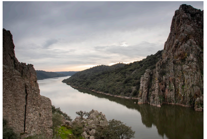
Salto del Gitano

30 april. Tidig frukost på hotellet och därefter skådning på stäppen mellan hotellet och Santa Marta de Magasca och sedan vidare till Llanos de Cáceres. Dessa områden är bra för arter som stortrapp, småtrapp, svartbukig och vitbukig flyghöna samt blåkråka. Tillbaka till hotellet för lunch och siesta. På eftermiddagen transport till Monumento Natural Los Barruecos för fotografering av bland annat vita storkar i det spektakulära landskapet med helt unika granitformationer. Middag på hotellet.