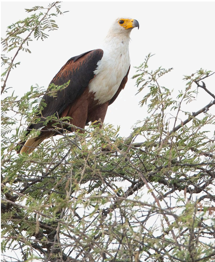
African Fish Eagle

10 november. Efter utcheckning och frukost, morgonpromenad runt risfälten nära hotellet där vi fotograferar våtmarksfåglar som African Jacana, olika hägerarter och mycket annat. Under eftermiddagen båttur på Gambiafloden där vi hoppas se och fotografera arter som Hadada Ibis, Blue-breasted Kingfisher och African Fish Eagle. Från båten har vi även fina chanser på flera olika arter apor. Middag på Island Hotel.