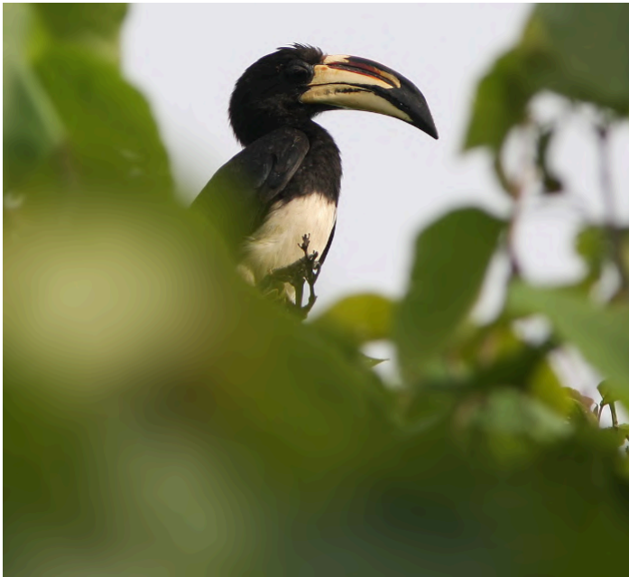
African Pied Hornbill

6 november. Denna dag blir det fokus på lokalerna Kotu Creek och Fajara Golf Course, båda två belägna nära vårt hotell. Vid Kotu Creek kommer vi även att åka på en kanottur med goda möjligheter att få fina bilder på flera arter kungsfiskare och olika hägrar. Området runt golfbanan bjuder ofta på såväl blåkråkor och biätare som näshornsfåglar och solfåglar. Middag på Bamboo Garden Hotel.