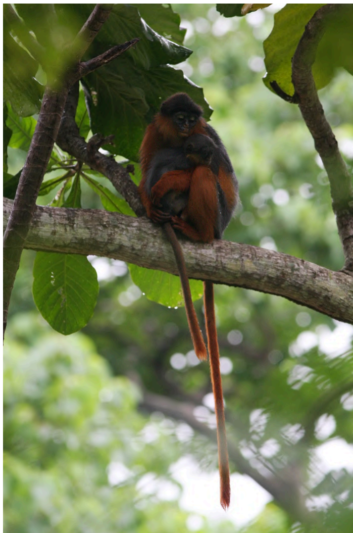
Western Red Colobus