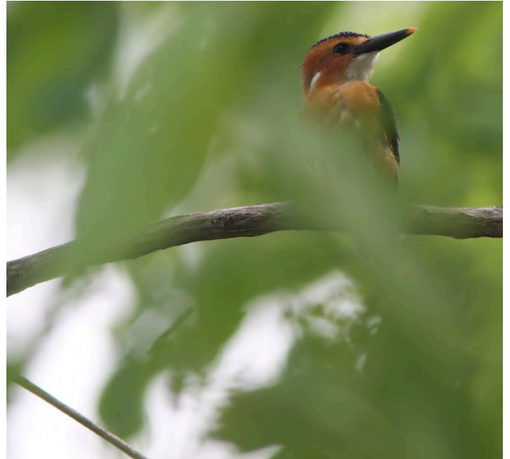
African Pygmy Kingfisher

7 november. Transport till Tanji Bird Reserve efter frukost, ett fint lagunområde som hyser stora mängder vadare och tärnor. Strandskogen strax innanför är också rik på fågel och vi letar arter som Swallow-tailed Bee-eater, Bearded Barbet och Oriole Warbler. På eftermiddagen kommer vi att sitta några timmar i ett gömsle vid Brufut Woods. Arter som ofta kommer för att dricka utanför gömslet är bland annat Blue-spotted Wood Dove, Violet Turaco, African Paradise Flycatcher och Snowy-crowned Robin Chat. Middag på Bamboo Garden Hotel.