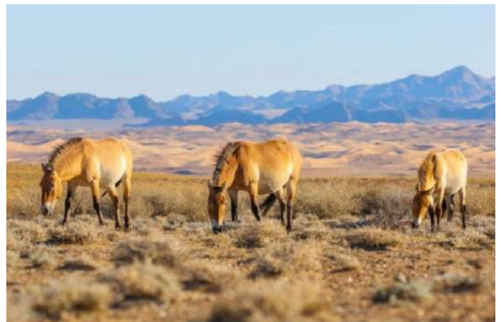
Przewalskis häst.

13 oktober. Vi lämnar lodgen tidigt för att utnyttja morgonens svalare temperatur när vi kör genom sanddynerna. Vårt mål är Jargalantberget och det tar cirka 6–7 timmar dit med alla våra stopp för att titta på landskapet, djur och fåglar. Vi anländer till vårt nästa basläger på eftermiddagen. Lägret med färdiguppställda jurtor ligger vid foten av de över 3 000 meter höga bergen. Det drivs av en lokal nomadfamilj som har sina djur i området. Natt i jurta i det privata lägret.