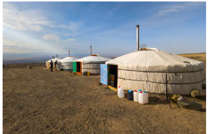
Traditionella jurtor.

18 oktober. Resan avslutas på Ulaanbaatars internationella flygplats.