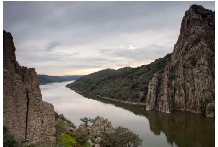
Salto del Gitano

30 april. Tidig frukost på hotellet och därefter skådning på stäppen mellan hotellet och Santa Marta de Magasca och sedan vidare till Llanos de Cáceres. Dessa områden är bra för arter som stortrapp, småtrapp, svartbukig och vitbukig flyghöna samt blåkråka. Tillbaka till hotellet för lunch och siesta. På eftermiddagen transport till Monumento Natural Los Barruecos för fotografering av bland annat vita storkar i det spektakulära landskapet med helt unika granitformationer. Middag på hotellet.