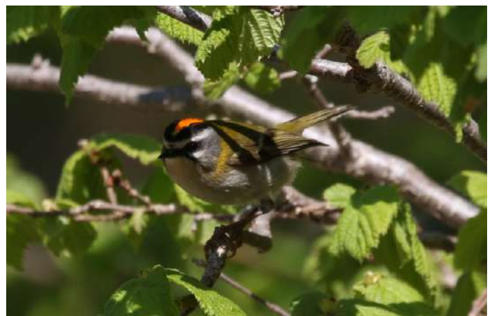
Brandkronad kungsfågel.

då man låter döda träd ligga här var miljön otroligt fin för hackspettar. En brandkronad kungsfågel sågs också, en art som är på spridning även på denna sidan Östersjön. Därefter besökte vi Kanierisjön i uppehållsväder och lite sol, men blåsigt och rätt kyligt. Fler vassångare hördes, några gråhakedoppingar hittades och rätt många gulärlor och svalor. Sedan tillbaka till hotellet för frukost. Därefter ihoppackning och skådning längs med kusten upp till vårt nästa stopp, Roja. Kylan hade lagt hämsko på rastarna, men vi såg våra första vita storkar, en art som skulle följa oss dagligen då varje by här har minst ett storkbo, och inte minst en fin citronärlehanne på häcklokal vid Mersrags.