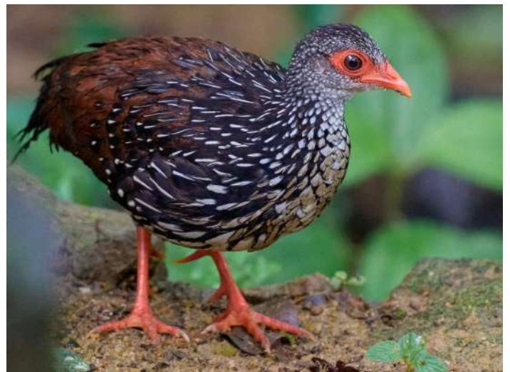
Sri Lanka Spurfowl

19 februari. Efter frukost, avfärd till flygplatsen för hemresan.