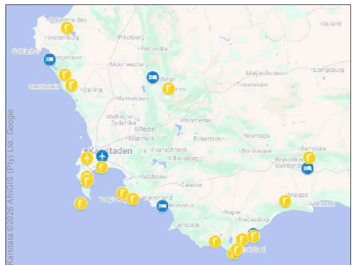
Fågellokalerna under resan. Se dag-för-dagprogrammet.

Det fågel- och djurliv som kännetecknar Västra Kapprovinsen är på många sätt världsunikt och Krugerparken bjuder på en fin representation av tropiska Afrikas arter. Vi uppmärksammar särskilt den speciella kapfloran och världsunika miljöer som fynbos, karoo och renosterveld. Vi också hoppas få se många av Afrikas mest välkända däggdjur som giraff, zebra och flodhäst, men också en lång rad antiloper och vildhund. Drygt 50 olika däggdjursarter bör kunna ses, inklusive chans på Big Five (elefant, afrikansk buffel, lejon, leopard och noshörning). Om vädret är med oss får vi även se ett antal marina däggdjur under en heldags havsfågeltur. Utöver en stor bredd på naturupplevelser kommer du få möjlighet till en vinprovning, färdas genom rooibosens kärnområden och besöka ett av landets bästa platser för klippmålningar. En höjdpunkt blir också de hissande vyerna vid Blyde River Canyon – en av världens djupaste kanjoner.