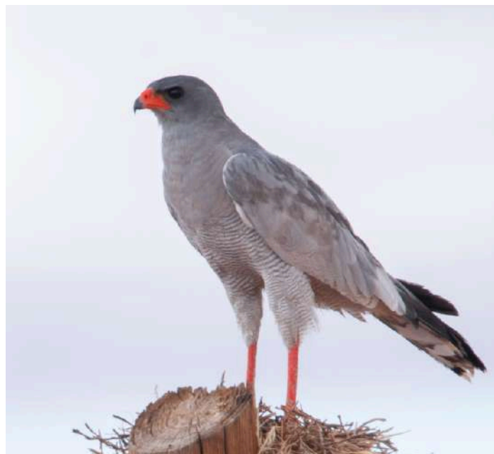
Pale Chanting Goshawk

19 september. Vi inleder morgonen med att vandra längs en stig som kallas Sevilla Rock Art Trail. Längs den cirka tre kilometer långa promenaden i bergig men tämligen lättgången terräng, finns flera av provinsens finaste klippmålningar. De är upp till 8000 år gamla och bär vittnesbörd om det jägar- och samlarfolk (san) som länge bebodde södra Afrika och vars kultur idag bara lever kvar hos några mindre grupper längre norrut i Namibia och Botswana. Vi vandrar längs en ibland nästan uttorkad flodfåra, och har nya chanser på möten med Karoons unika fåglar, växter och djur. Tillbaka på boendet checkar vi ut och beger oss tillbaka mot Clanwilliam och vidare ut mot kusten. Målet är Veldrif och Berg River Estuary. Här väntar saliner, kust och våtmarker med god chans på två arter flamingo, Chestnut-banded Plover, och kanske ytterligare några nya vadare. Vi håller också utkik efter den mest långnäbbade rasen av Cape Long-billed Lark, och flera andra Karoo-arter som återfinns även nära kusten. När vi känner oss klara checkar vi in på vårt hotell i Langebaan, där vi också äter middag.